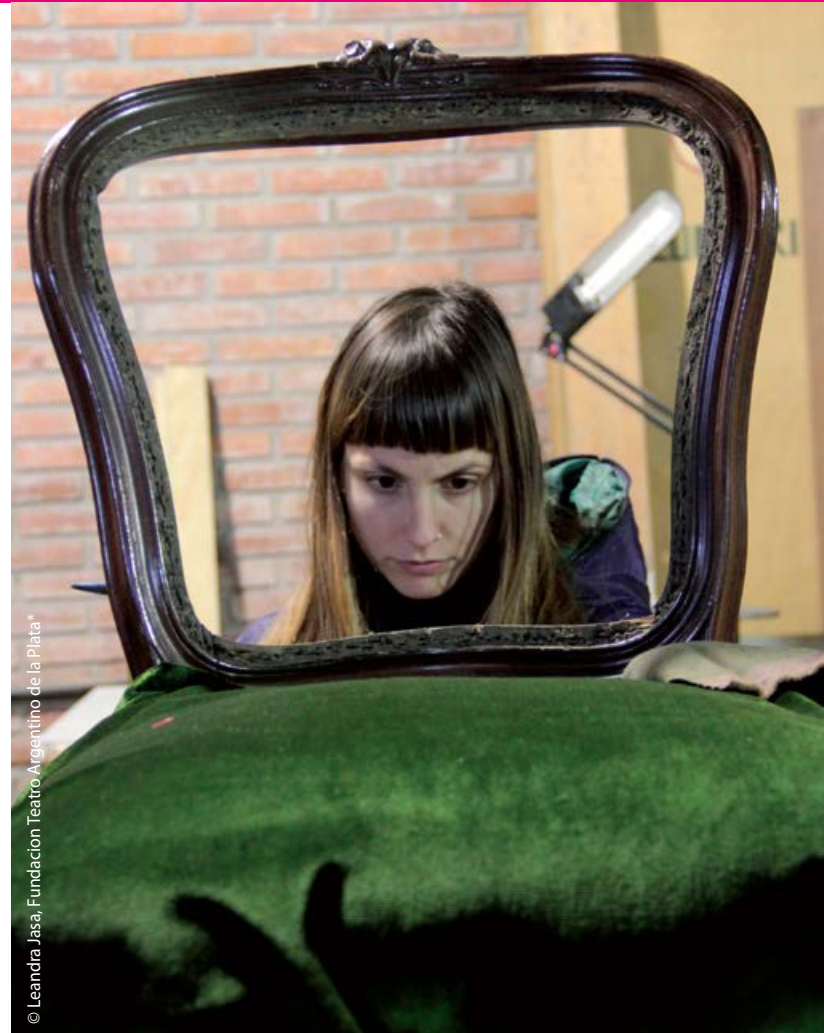
© Leandra Jasa, Fundación Teatro Argentino de la Plata*