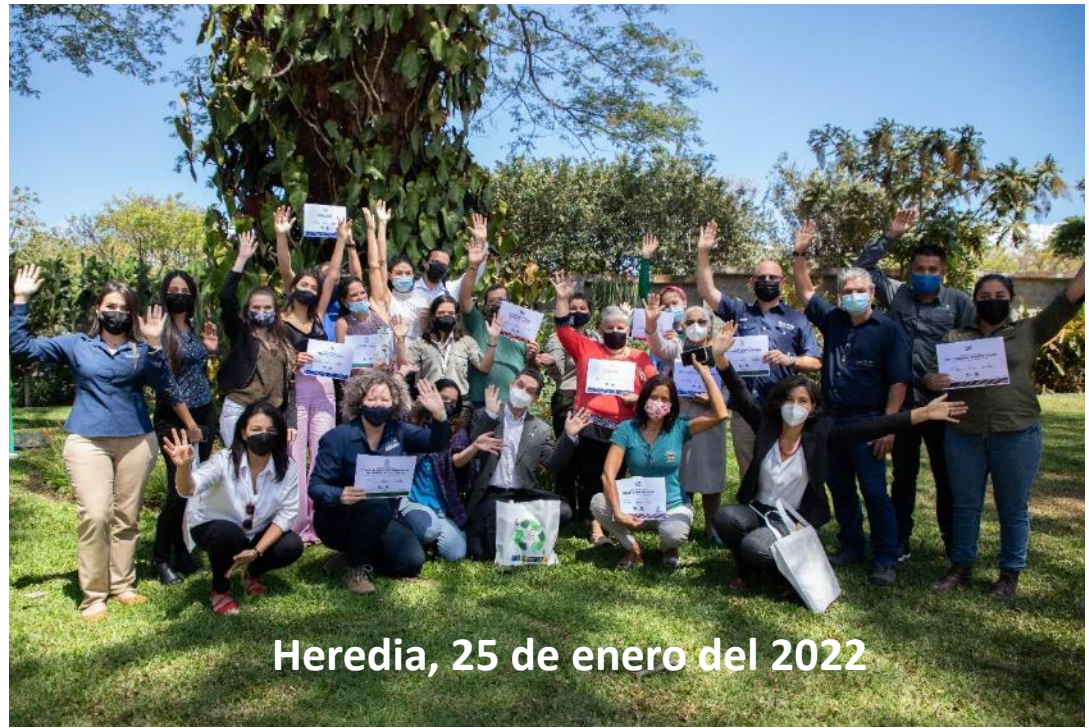
Heredia, 25 de enero del 2022

Launch of the Costa Rican biosphere reserve brands initiative and recognition of the first 14 businesses that implement the brands.