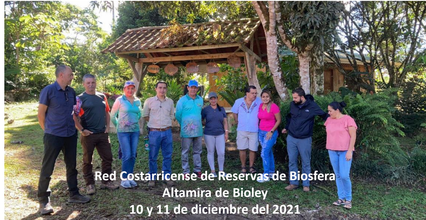
Red Costarricense de Reservas de Biosfera Altamira de Bioley 10 y 11 de diciembre del 2021