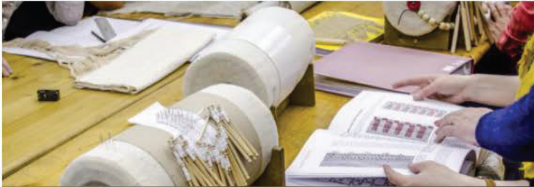
The Skill Of Bobbin Lace Making (2018)