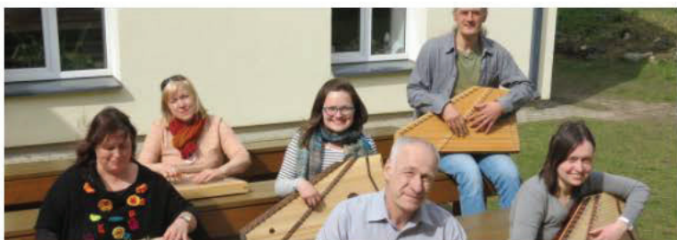
Caurspēlējāmās cītaras spēle (2018)