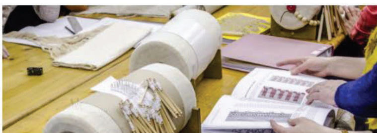
Knipelēšanas prasme (2018)