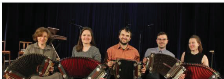
Pēterburgas ermoņiku spēlēšanas tradīcijas (2018)