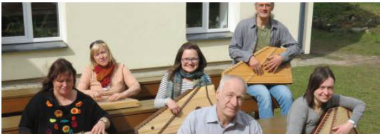
Latvian Melodic Zither performance (2018)