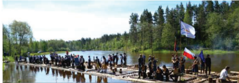
Traditional Timber Rafting Skills on the Gauja River (2018)