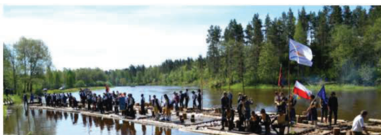
Gaujas plostnieku amata prasmes (2018)