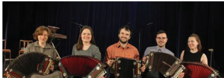
The Petersburg harmonica performance traditions (2018)