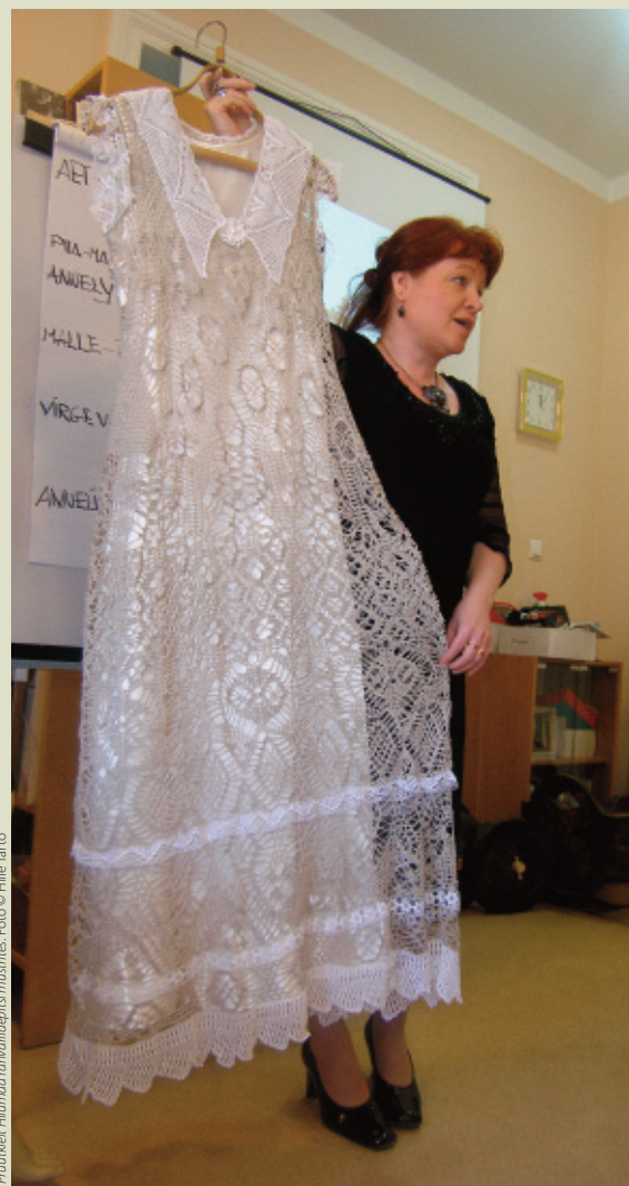
Pruutkleit Hiiumaa rahvanäpitsi muustries.

Riigi tasandil seab konventsioon eesmärgiks kaitsta riigi territooriumil leiduvat vaimset kultuuripärandit. Muu hulgas tuleb selleks koos kogukondade ja vabaühendustega jõuda selgusele, millised teadmised, oskused, kombid ja tavad on inimestele olulised ning vajavad kaitset. Igas riigis tuleb luua oma vaimse kultuuripärandi nimistu(d) ja neid pidevalt uuendada. Samuti loetleb konventsioon mitmeid võimalusi, kuidas kaitsta vaimset kultuuripärandit ning luua selleks paremad tingimused, kuidas suurendada teadlikkust vaimsest kultuuripärandist, näiteks kasutades ja arendades haridusasutuste võimalusi.