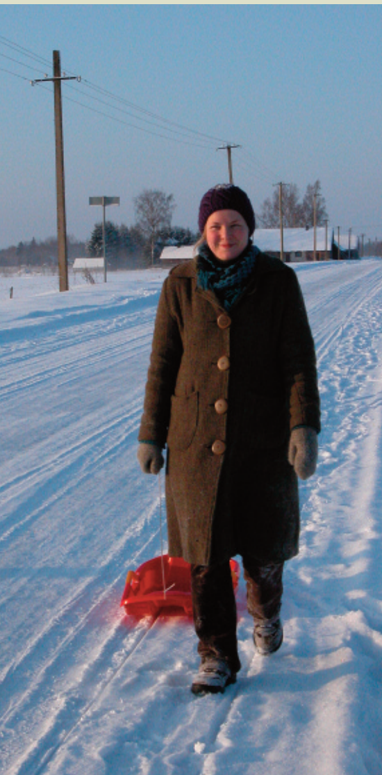
Olgu, sran või salkokas - rahvalooming - raivvalmistab ikka rõõmu.

Rahvusvahelisel tasandil kohtuvad kõik konventsiooniga ühinenud riigid iga kahe aasta järel üldkogul, kus võetakse vastu strateegilised otsused konventsiooni rakendamiseks ning valitakse 24-liikmeline vaimse kultuuripärandi kaitse valitsustevaheline komitee. Komitee kohtub igal aastal, et edendada ja jälgida konventsiooni sihtide saavutamist.