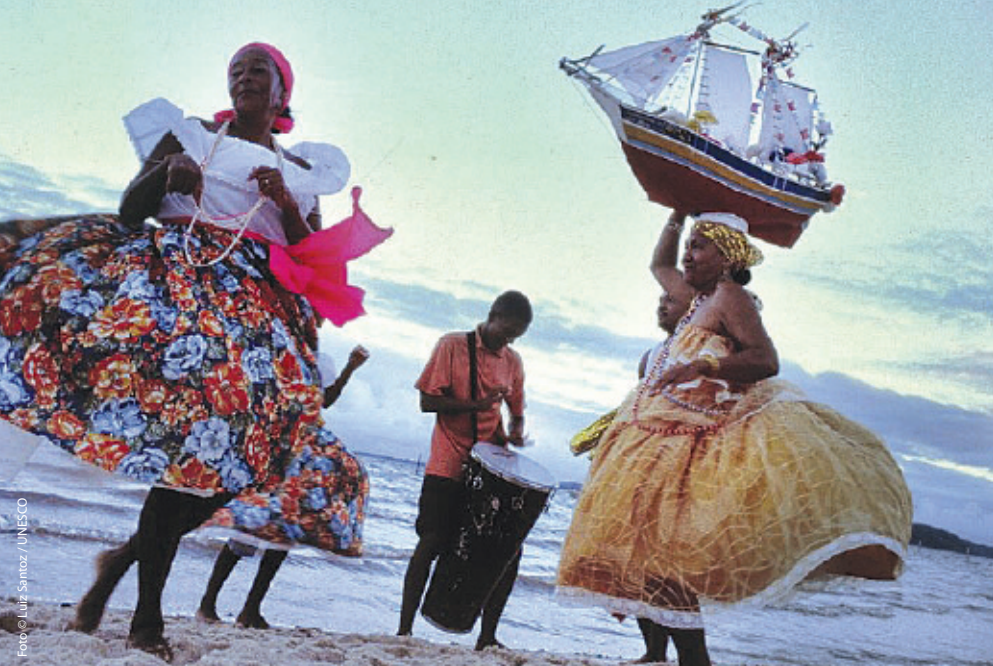
📍 Samba de roda Brasíilia Bahia osariigis.