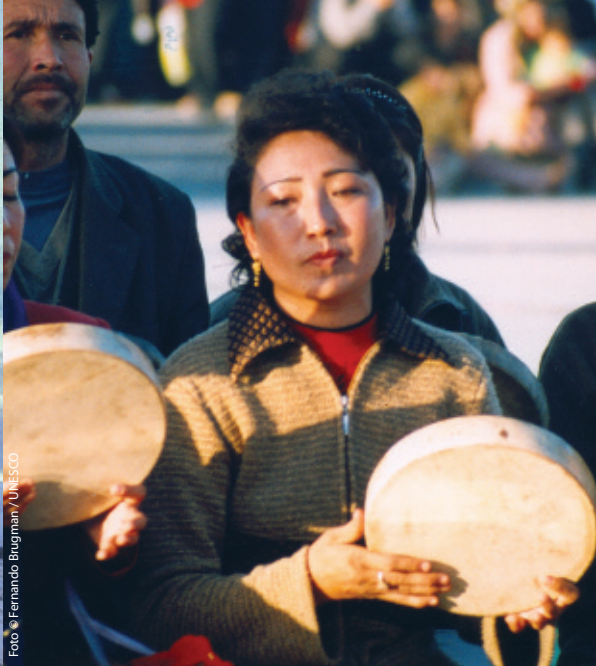
📍 Hiina Xinjiangi piirkonna uiguuride mugaami-traditsioon hõlmab erilmelisi laule, tantse ja muusikat.