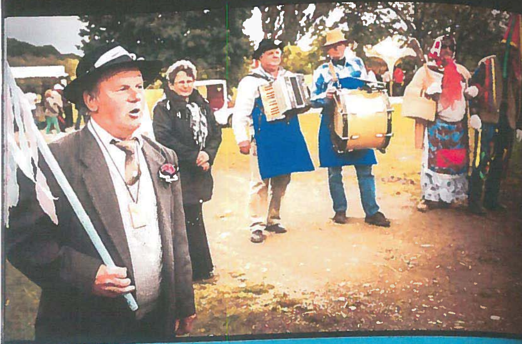
Rábavidéki szlovének rönkhúzása (2015)