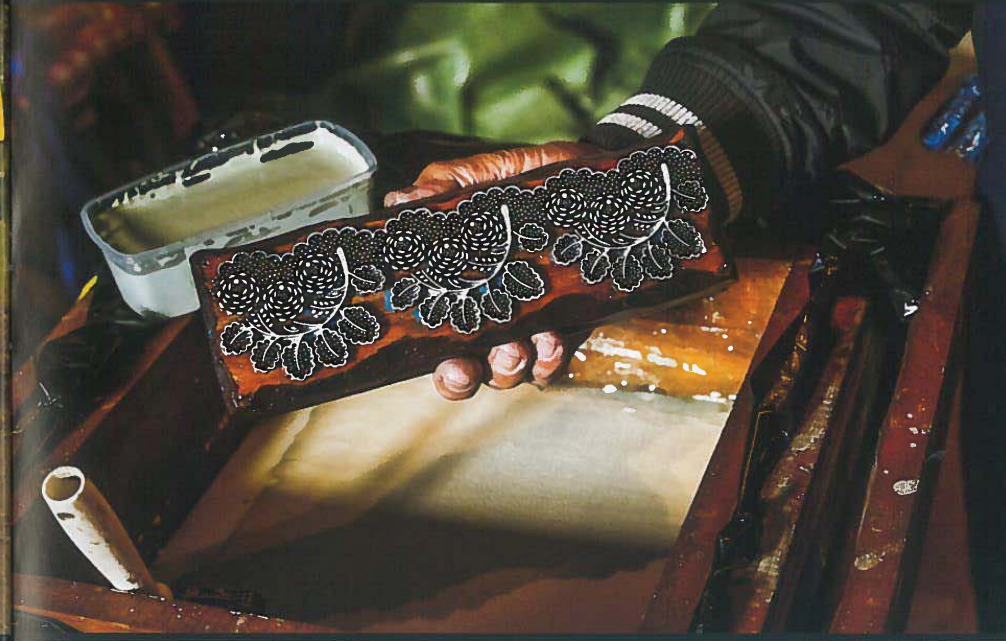
The Hungarian Tradition of Blueprinting (2015)

Historically the spread of log pulling characterized the border of Hungary, Austria and Slovenia. This dramatic, popular custom was practised in the Carnival season if nobody got married during this period. It is still organized according to this rule in these days. The maids have to pull a metres long pine log throughout the streets of the village while the participants are playing different kind of parodies. The procession is accompanied by many typical genre figures and a music band. They are closing the day with ball. The custom not only preserves the language (Hungarian and Slovenian), but also strengthens the identity of the community. Beside the aim to inspire the youth to marry and have a family it is also important element of the preservation of their identity.