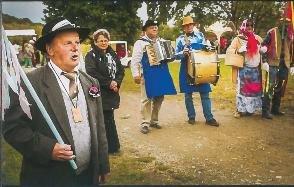
Logpulling of the Slovenians of the Rába Region (2015)