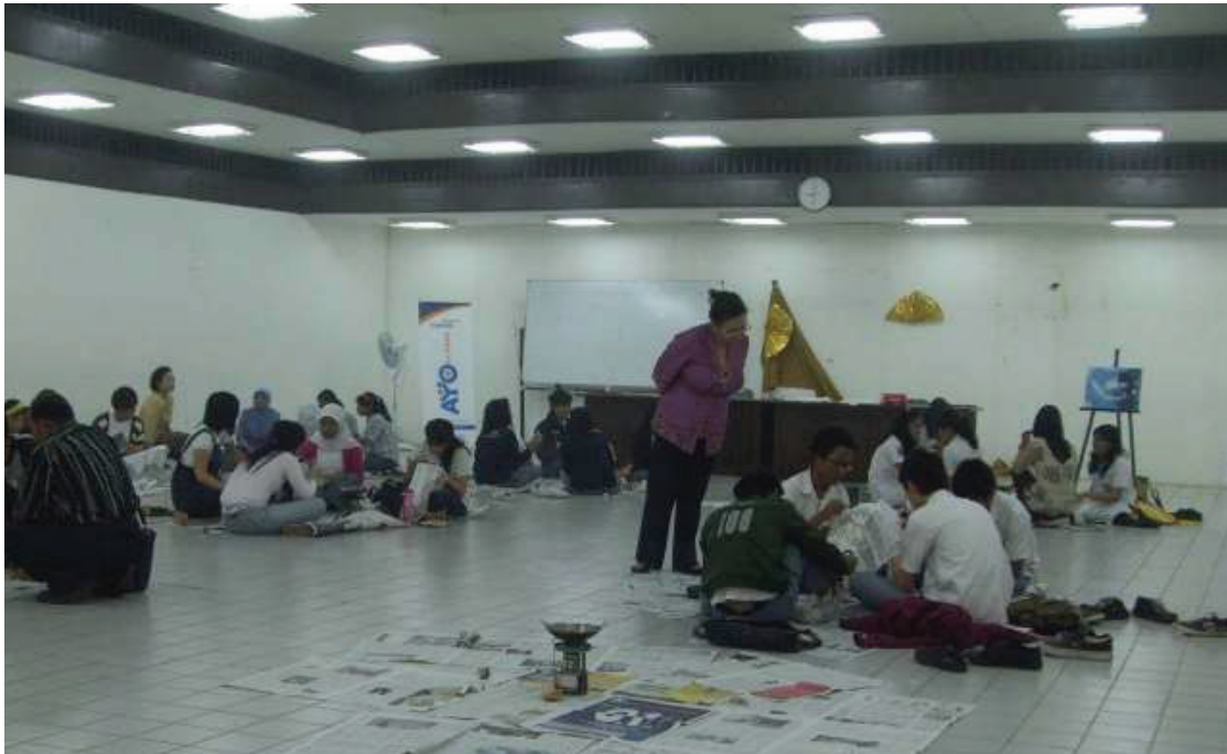
GELAR BATIK NUSANTARA 2019