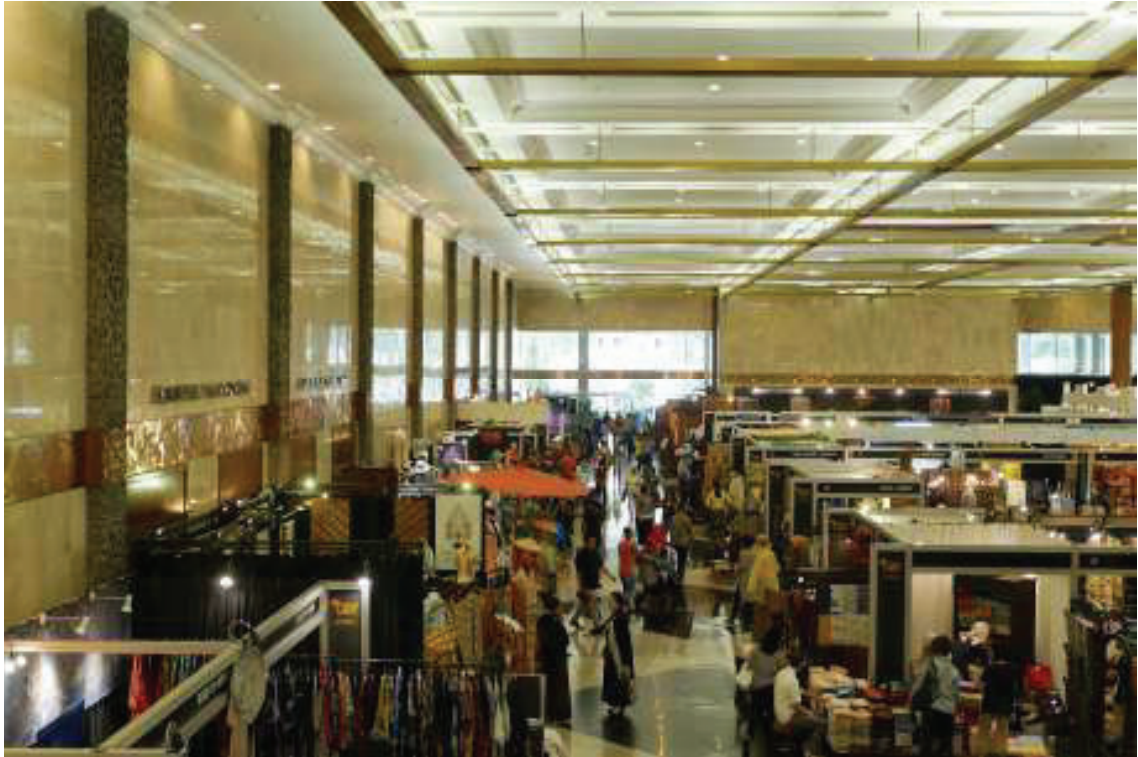
AWARD-WINNING BATIK CRAFTSMAN