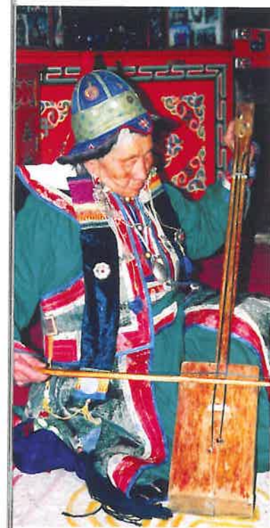
Traditionele muziek van de Morin Khuur, Mongolië