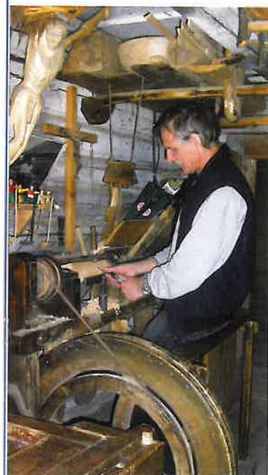
☞ Vervaardigen van kruisen in Litouwen