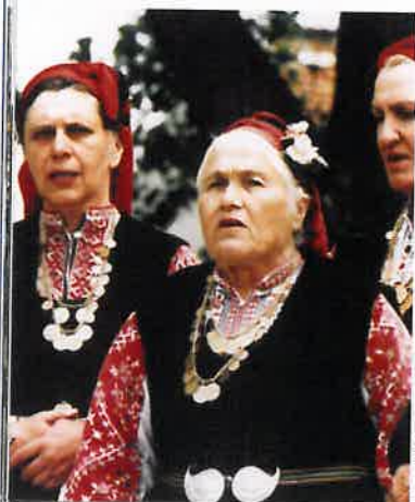
☞ Oude Bistriza Babi-polyfonie, dans en rituelen uit de Shoploukregio, Bulgarije