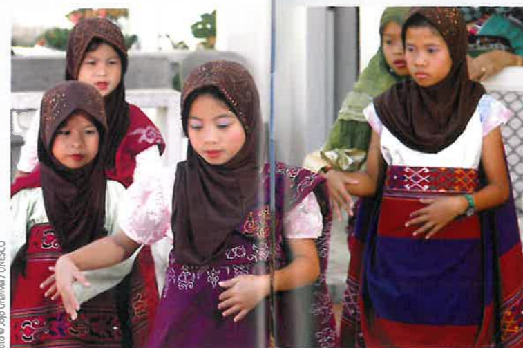
Het episch verhaal van het Maranao-volk van het Lanao-meer, Filippijnen