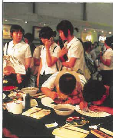
Het Gangneung Danoje festival, Zuid-Korea