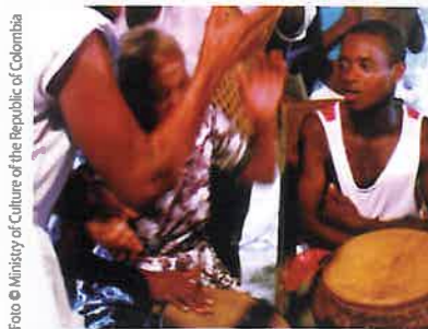
Foto © Ministry of Culture of the Republic of Colombia © Culturele ruimte van Palenque de San Basilio, Colombia