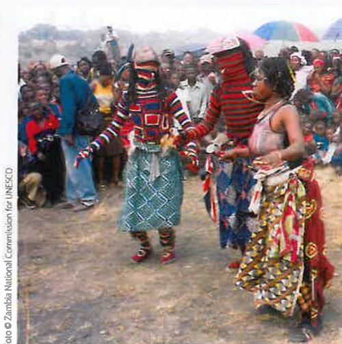
Zambia National Commission for UNESCO