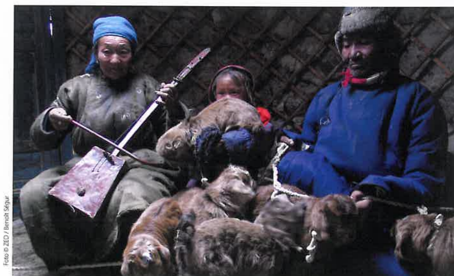
☞ Urtiin Duu – Traditionele folkmuziek, Mongolië en China