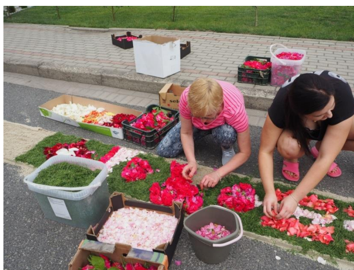
fol. J. Banik

This tradition is practiced by all age groups, especially families. In the opinion of local residents, if the tradition had been discontinued it would have been a great loss for the whole community, not only in terms of culture and identity, but also in terms of integration.