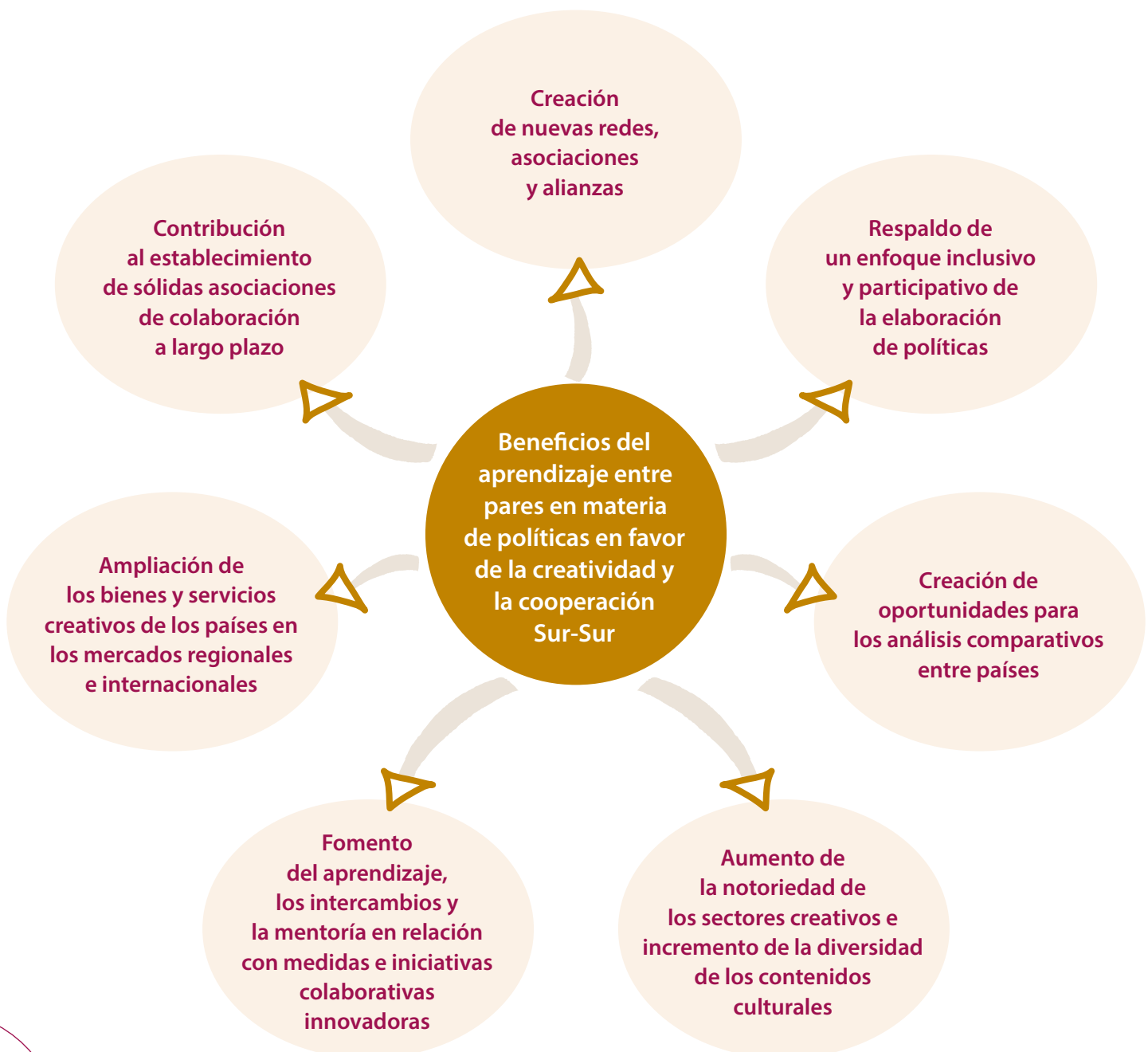
Gráfico 2 • Beneficios a largo plazo del aprendizaje entre pares en materia de políticas en favor de la creatividad y la cooperación Sur-Sur

Los beneficios a largo plazo del aprendizaje entre pares son múltiples. Puede influir en los procesos de elaboración de políticas y orientar sobre políticas, normativas y medidas sostenibles para la creatividad. Confiere mayor amplitud a la puesta en práctica de una elaboración de políticas participativas, aumenta el compromiso y la interacción entre pares más allá de las discusiones en el marco del proceso, y podría tener efectos indirectos positivos en otras redes y organizaciones internacionales. La siguiente imagen ilustra los principales beneficios a largo plazo que se han determinado durante el aprendizaje entre pares.