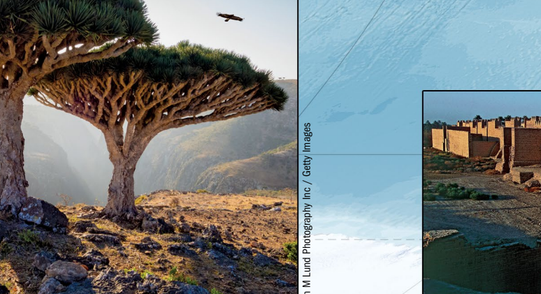
DRP LACE / The World Heritage Collection