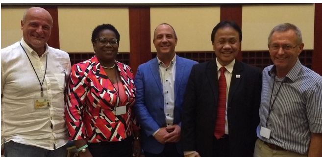
Des experts en EFTP au 11ème Forum de dialogue politique