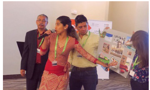
Programme de l'UNEVOC pour le leadership en EFTP à Panama

Les programmes régionaux de l'UNEVOC pour le leadership en EFTP menés en 2018 ont dispensé à cinquante experts en EFTP de vingt-cinq pays et trente-neuf institutions une formation de meneurs de la transformation. Ce réseau de meneurs de l'EFTP continue d'impulser un élan vital à la transformation de l'EFTP et vient à l'appui des objectifs de développement au niveau national, régional et mondial.