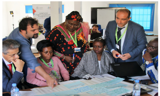
Programme de l'UNEVOC pour le leadership en EFTP à Dakar