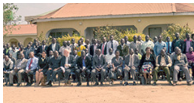
Le Programme STEP au Malawi

Alors que le système du Malawi devient plus décentralisée, il faut développer les capacités de gestion des dirigeants des institutions. Le Programme STEP a pour but d'améliorer