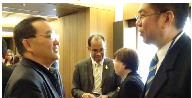
Les participants à l'atelier de consolidation du groupe multipays d'Asie de l'Est et du Sud-Est du Réseau UNEVOC