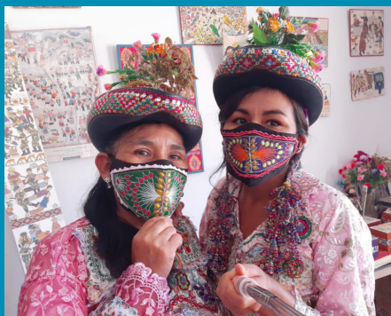
© Venuca Evaran, Yoleita Quispe y