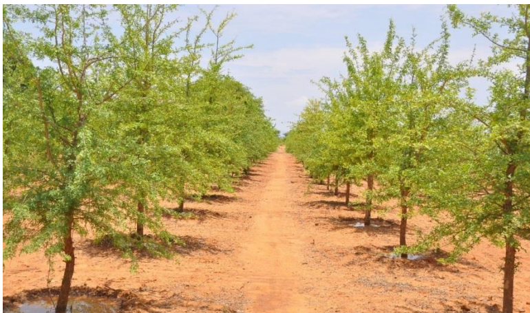
Thanakha Farm at Bagan