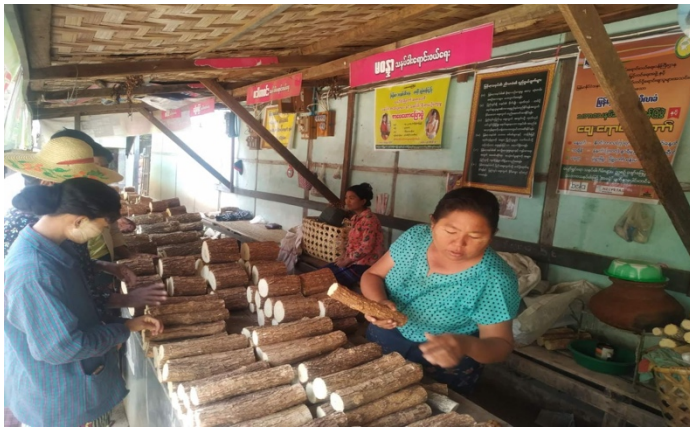
သနပ်ခါးရောင်းချသူများ