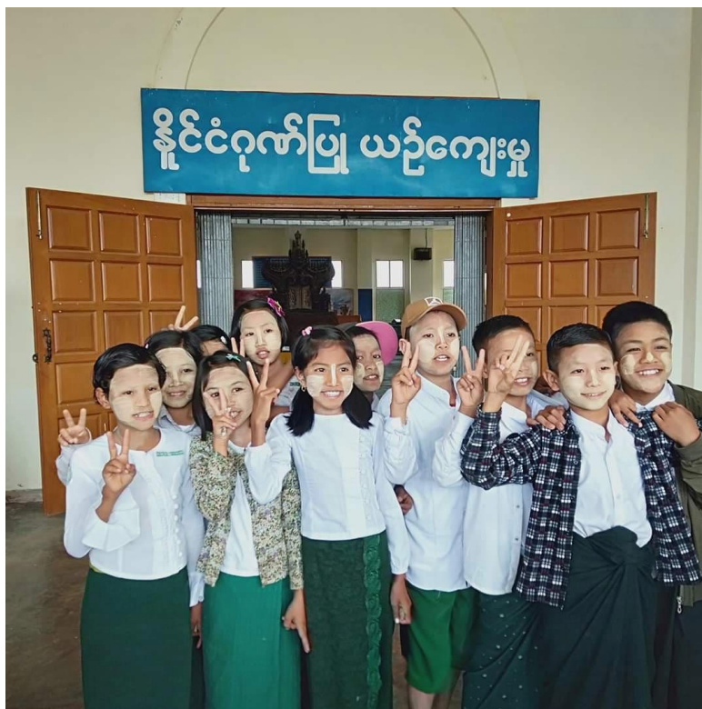
Applying Thanakha by Students