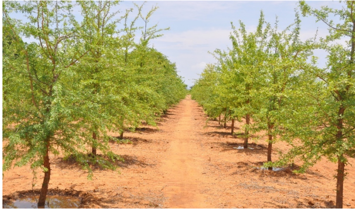
သနပ်ခါးစိုက်ခင်း