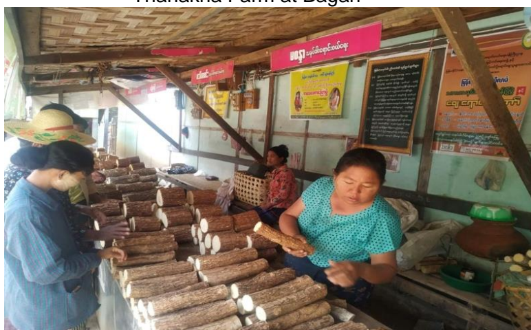
Thanakha Vendors (Magway)