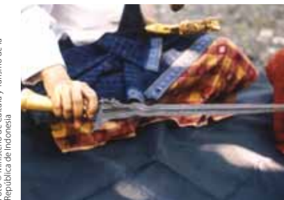
Foto © Ministerio de Cultura y Turismo de la República de Indonesia