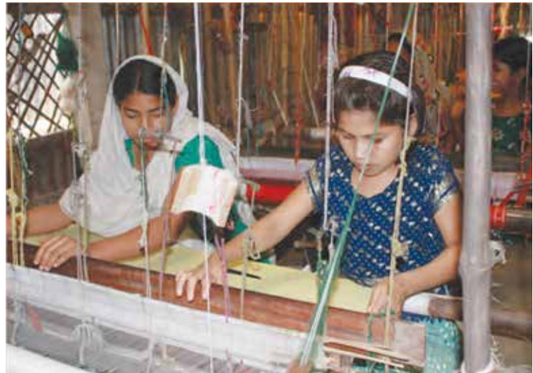
© 2012 by Firoz Mahmud – Photograph: Mursid Anwar

berkaitan dengan kesamarataan gender seperti CEDAW dan Protokol 4 Pilihannya boleh dijadikan rujukan yang berguna. Tambahan pula, bagi menjadikan tugas-tugas dasar lebih inklusif dan efektif, ia perlu mengambilkira kepelbagaian amalan berkaitan gender yang wujud di wilayah sesebuah negeri.