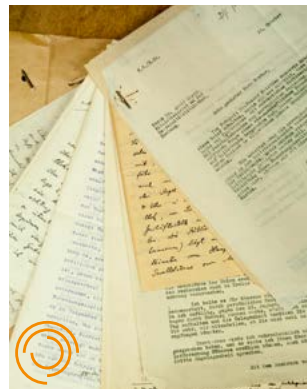
Archives of the International Institute of Intellectual Cooperation, 1925-1946 Inscribed on the Register in 2017 Memory of the World

770 000 pages d'archives de l'Institut International de Coopération Intellectuelle (1925-1946) , le précurseur de l'UNESCO. Les archives de l'Institut constituent une précieuse source de connaissances sur la coopération internationale entre les deux guerres mondiales au travers de grandes figures emblématiques comme Albert Einstein, Marie Curie, Masaharu Anesaki, Gabriella Mistral, Taha Hussein, Rabindranath Tagore et Thomas Mann pour ne citer qu'eux. Les archives de l'Institut ont été inscrites au Registre « Mémoire du monde » de l'UNESCO en 2017.