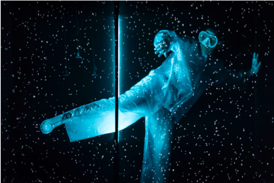
Céto © Nicolas Richard