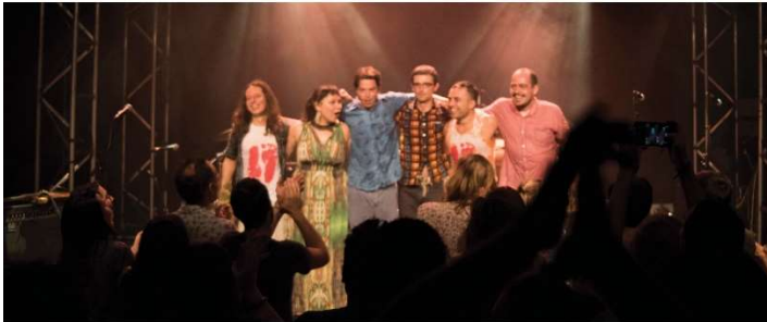
20 octobre 2017 - Marché Gare - Le public est enthousiaste