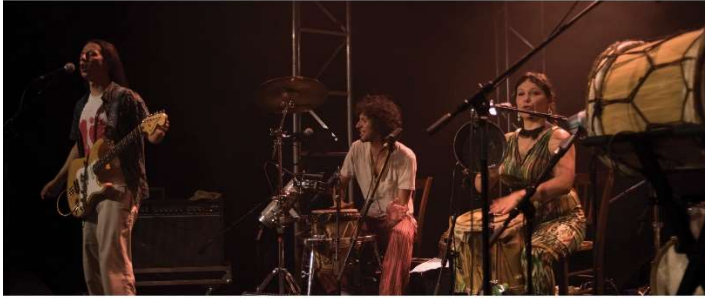
20 octobre 2017 - Marché Gare - Concert de Curupira