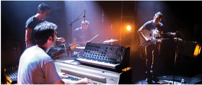
20 octobre 2017 - Marché Gare - Première partie avec le groupe français Direction Survet