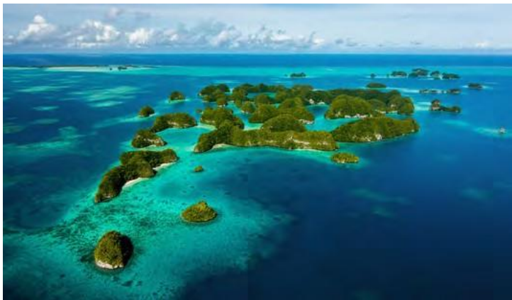
Laguna Sur de Rock Islands, Palau