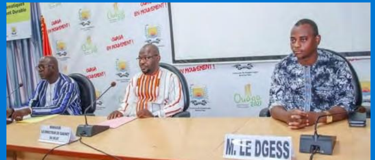
© Ministerio de Cultura, Burkina Faso