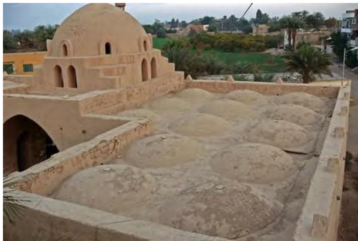
Nuevo Gourna, diseñado por Hassan Fathy © 2020 Todos los derechos reservados Ahram Online.

A través de Alianza para la Transición Urbana, las ciudades con un legado industrial de todo el mundo han estado colaborando para abordar los desafíos que plantea la transición y encontrar nuevas soluciones. Las ciudades de la Alianza incorporan enfoques basados en la equidad en sus proyectos de transición. El marco de equidad de la Alianza para la Transición Urbana, desarrollado a base de los esfuerzos progresistas de las ciudades miembro para abordar las desigualdades locales, tiene como objetivo ayudar a las ciudades priorizar las oportunidades para los residentes locales al diseñar sus intervenciones climáticas y ambientales, con especial consideración de los grupos vulnerables y desfavorecidos. Vuelva a ver las sesiones y saber más .