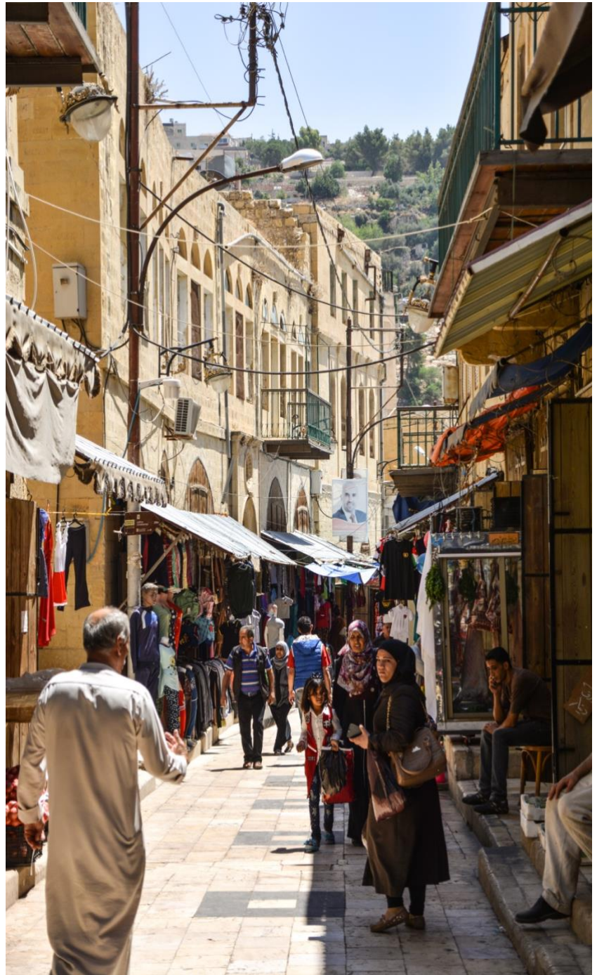
De compras en la calle Hammam. As-Salt (Jordania) - Lugar de Tolerancia y Hospitalidad Urbana.