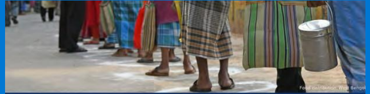
Photo distribution: West Bengal