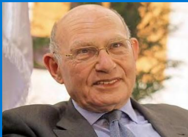
Jad Tabet Arquitecto, urbanista, ex representante ante el Comité del Patrimonio Mundial de la UNESCO, presidente de la Federación Libanesa de Ingenieros y Arquitectos, y presidente de la Organización de Arquitectos Árabes.

En un contexto de una gran crisis política y corrupción en toda la administración nacional, las autoridades públicas no estaban a la altura como para responder a la magnitud de la tragedia. Además, la crisis económica sin precedentes en el Líbano y el colapso del sistema financiero y bancario hicieron imposible planificar una reconstrucción basada en inversiones masivas de capital privado. Por lo tanto, gracias a la movilización de la sociedad civil, asociaciones y ONG, fue posible responder a las necesidades más apremiantes de la población y poner en marcha operaciones de rehabilitación en estos barrios con el apoyo de la UNESCO, las organizaciones internacionales y la diáspora libanesa.