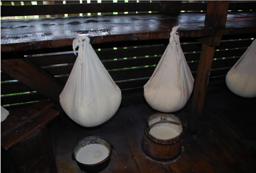
Izvorul Cailor, Rodna Mountains. Photo: Lucian David (2016)

traditional pastoral product produced by boiling of mutton, which is afterwards sealed in an airtight wooden container.