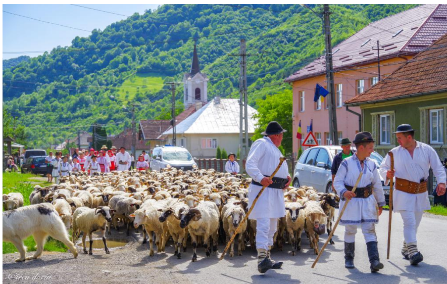
The Festival “Ancestors’s Celebration”, Popas Putredu Moara, Bistrița-Năsăud (2019)