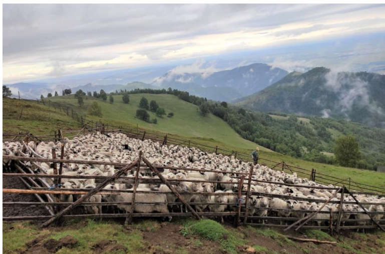
Strunga oilor (Coliba lui Capotă Dumitru), Rășinari, jud. Sibiu. Foto: Lucian David (iulie 2020)

Vechimea ocupației este confirmată de folclorul pastoral (literar, muzical, coregrafic), dintre care se disting cântecele epice cu tematică pastorală ( căntiți picurărești , în dialectul aromân), dintre care cea mai importantă este balada Miorița , iar din repertoriul muzical ritual-ceremonial pastoral melodiile Când urcă oile la munte , La măsurat , La făcutul cașului , A oilor , Cântec ciobănesc , Când coboară oile de la munte . Semnalele pastorale au o funcție semiotică precisă, iar dintre acestea menționăm: Chemarea oilor , Pe drum , Porneala , Șireagul , La muls ș.a. Dintre cântecele pastorale propriu-zise, se disting: Mi-a trecut Vinerea Mare , Măi ciobane de la oi , Pe drumul Banatului . Oieritul a consacrat de asemenea instrumente muzicale pastorale tradiționale, cum ar fi fluierul , buciumul , tilinca , cimpoiul . Dansuri create în mediul pastoral sunt Ciobănașul și Mocăncuța .