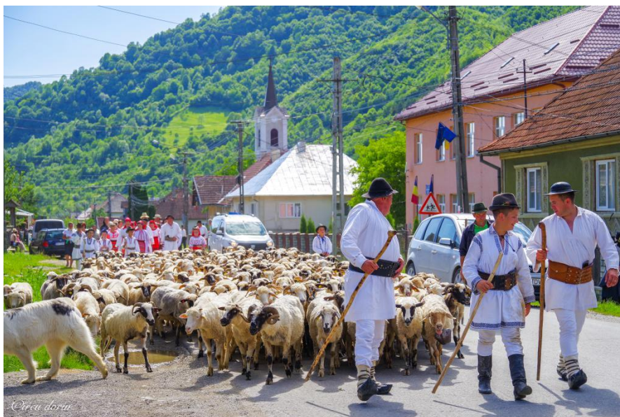
Festivalul „Sărbătoarea Străbunilor” în Ținutul Grăniceresc – Transhumanța, Stâna Popas Putredu Moara. Foto: Dorin Cîrcu, 2019

Harta Denumirea păzitorului de animale , autori Emil Țîrcomnicu, Lucian David, Atlasul Etnografic Român, vol. II, Ocupațiile , coord. Ion Ghinoiu, Editura Academiei Române, București, 2005