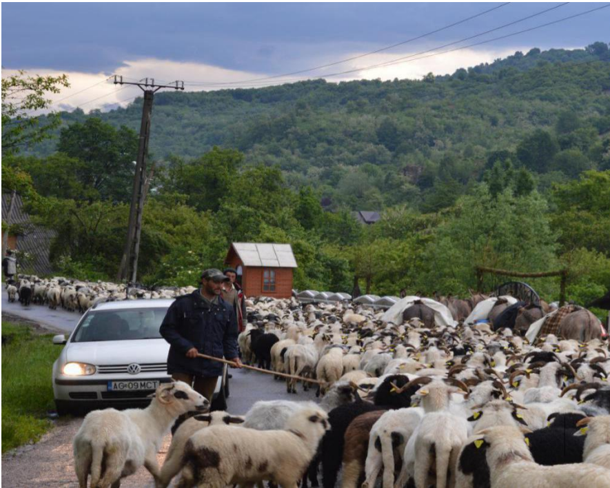
Urcațul oilor la munte, comuna Corbi, jud. Argeș.