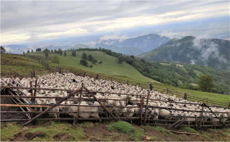
Rășinari, Sibiu.

rituals, ceremonies, popular traditions, and social events, among which the most important ones are the pastoral holidays.