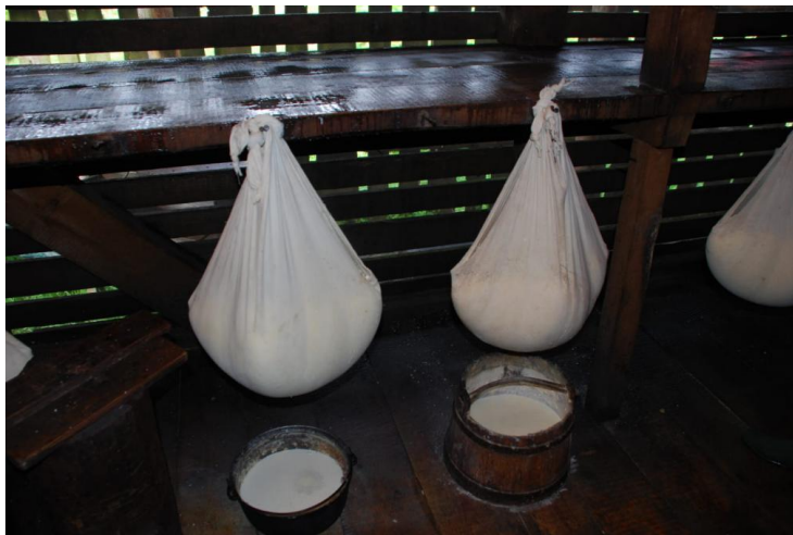
Storsul urdei în strecură, Stâna Izvorul Cailor, Munții Rodna. Foto: Lucian David (august 2016)

Din cultura pastorală transhumantă fac parte și cunoștințele legate de produsele alimentare, căci valorificarea laptelui reprezintă o caracteristică a păstoritului transhumant românesc. Dintre produsele pastorale tradiționale din lapte, cele mai importante sunt: brânza de burduf , cașul (afumat, uscat, covrigi de caș, păpuși de caș), urda , untul , telemeaua . O rețetă tradițională de prelucrare și conservare a cărnii este sloiul de oaie , preparat specific pastoral obținut prin fierberea, urmată de conservarea anaerată în recipiente de lemn a cărnii de oaie.