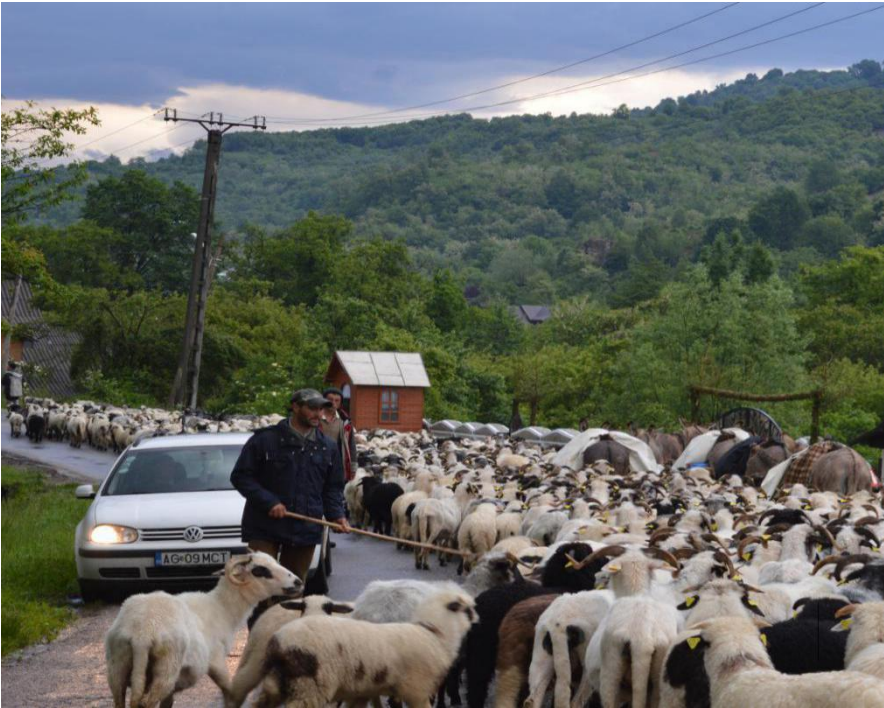
Flocks going up to the mountain, Corbi, Argeş county.

Geographical location of the element in the past. In order to appropriately use the pastures and hayfields, shepherds and their flocks travelled over long distances, sometimes hundreds of kilometres from their villages of origin (as far as the Jijiei Plain, in the northeast, and in the southeast as far as the Danube Delta, reaching even the shore of the Adriatic Sea and up to the Bosphoros, towards the great Russian steppes, and beyond). Therefore, the shepherds established “sheep roads” and “salt roads” (see The Map of the transhumance itineraries in Romania , by Tiberiu Morariu, 1942), which eventually became important circulation networks. The itineraries of Romanian-speaking transhumant shepherds extended in the northwest as far as the old Wallachian localities in the Northern Carpathians that are integrated today into the territories of Poland, Slovakia, and the Czech Republic, where the presence of the Wallachian shepherds is proven by pastoral terminology in local dialects and onomastics, by ethnographic elements and specific products and by-products.