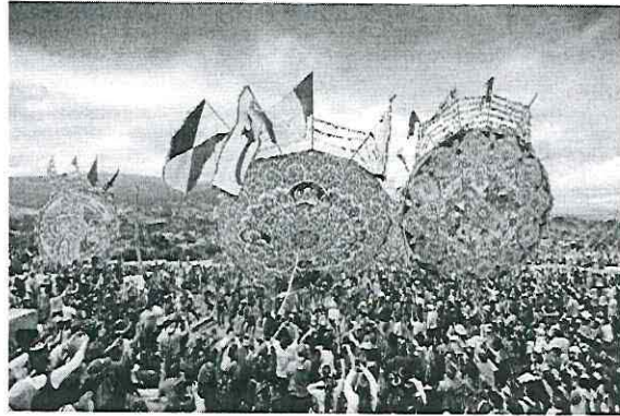
Feria de Barriletes Gigantes en Santiago Sacatepéquez. Ministerio de Cultura y Deportes, 2017.