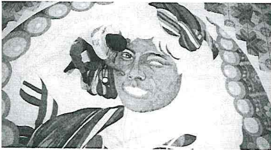
Barriletero de Sumpango. Ministerio de Cultura y Deportes, 2021.