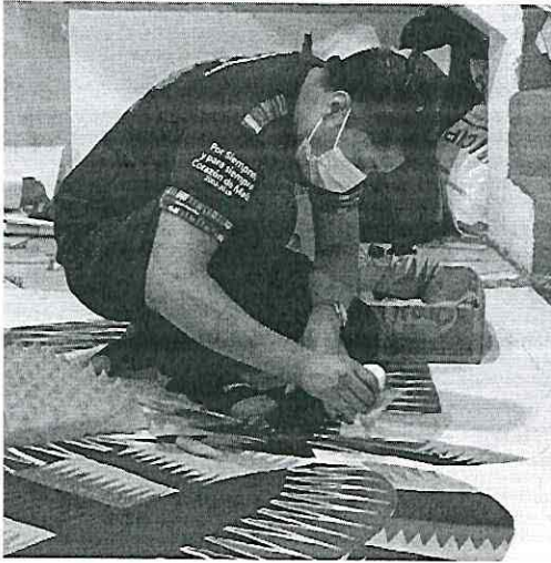
Barriletero de Santiago Sacatepéquez. Ministerio de Cultura y Deportes, 2021.