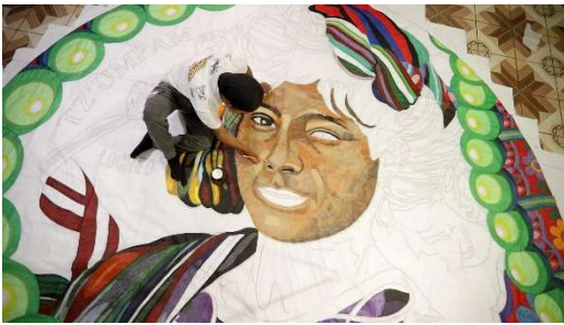
Barriletero from Sumpango. Ministry of Culture and Sports, 2021.