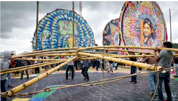
Giant Kite Fair in Sumpango. Ministry of Culture and Sports, 2013.