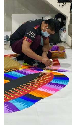
Barriletero from Santiago Sacatepéquez. . Ministry of Culture and Sports, 2021.