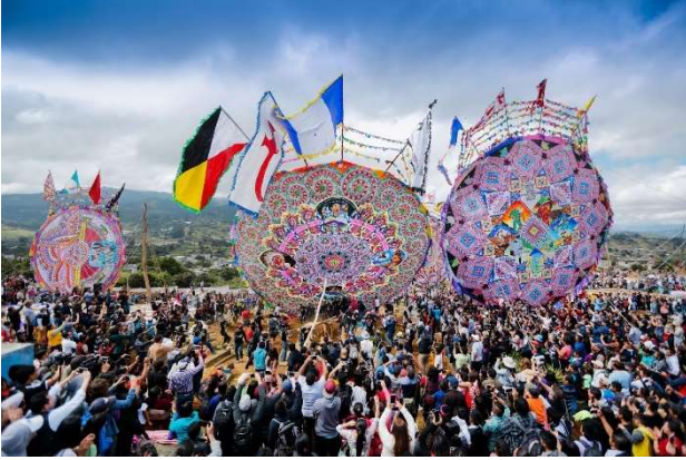
Giant Kite Fair in Santiago Sacatepéquez. Ministry of Culture and Sports, 2017.