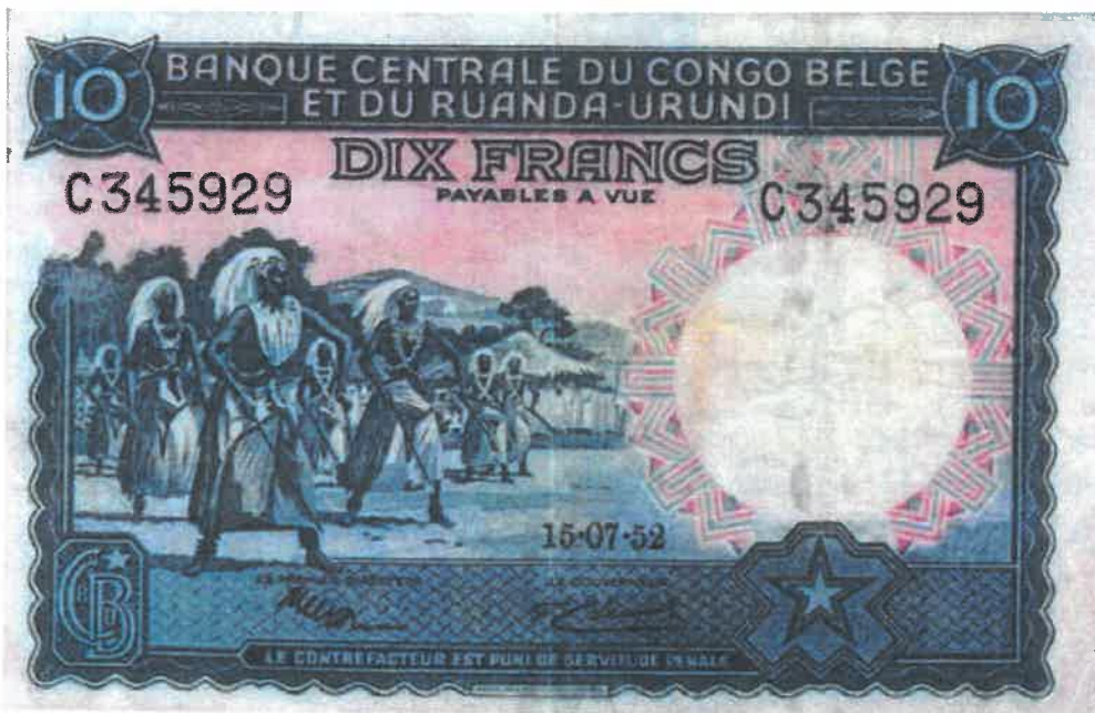
Ishusho y'Intore ku noti y'amafaranga 10 yashyizweho ku itariki 15/07/1952