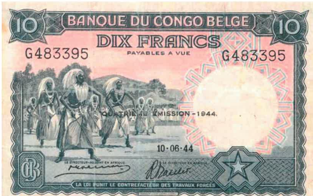
L'effigie d'Intore sur le billet bancaire de 10 francs émis le 10/06/1944