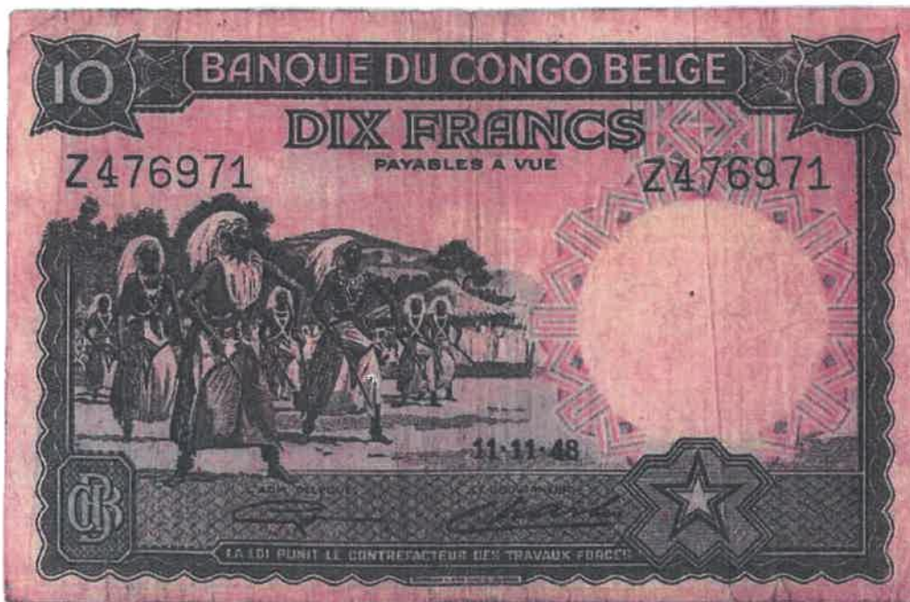
Ishusho y'Intore ku noti y'amafaranga 10 yashyizweho ku itariki 11/11/1948