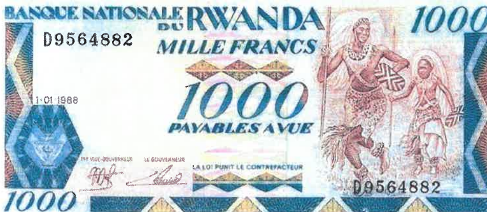
Ishusho y'Intore ku noti y'amafaranga y'u Rwanda 1000 yashyizweho ku itariki 1/01/1988