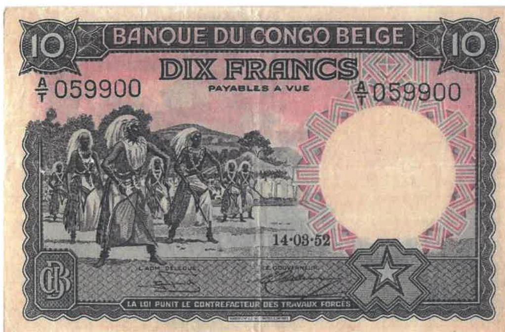
L'effigie d'Intore sur le billet bancaire de 10 francs émis le 14/03/1952