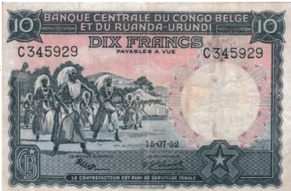
L'effigie d'Intore sur le billet bancaire de 10 francs émis le 15/07/1952