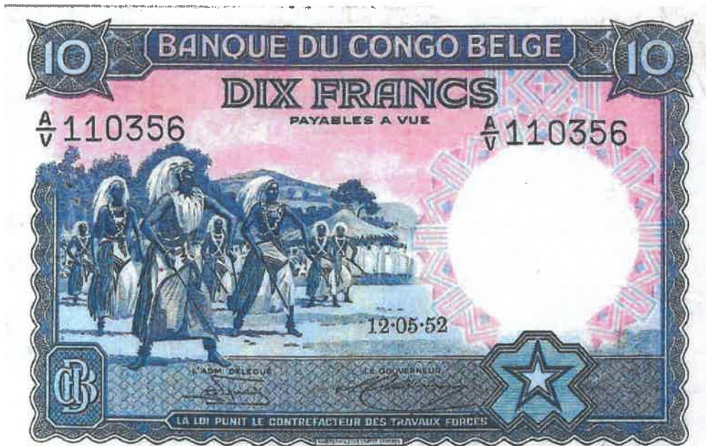
Ishusho y'Intore ku noti y'amafaranga 10 yashyizweho ku itariki 12/05/1952