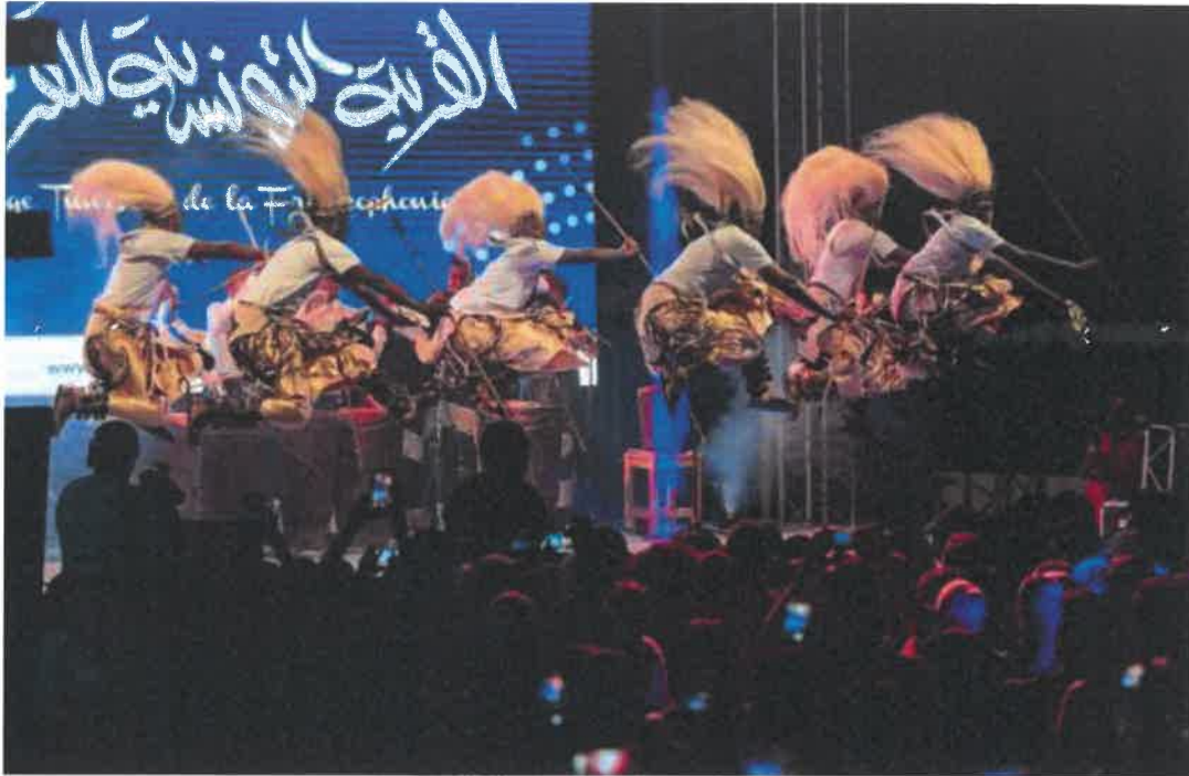
Les danseurs Intore du Ballet National du Rwanda, Urukerereza, lors du festival de la Francophonie, Tunisie, 2022