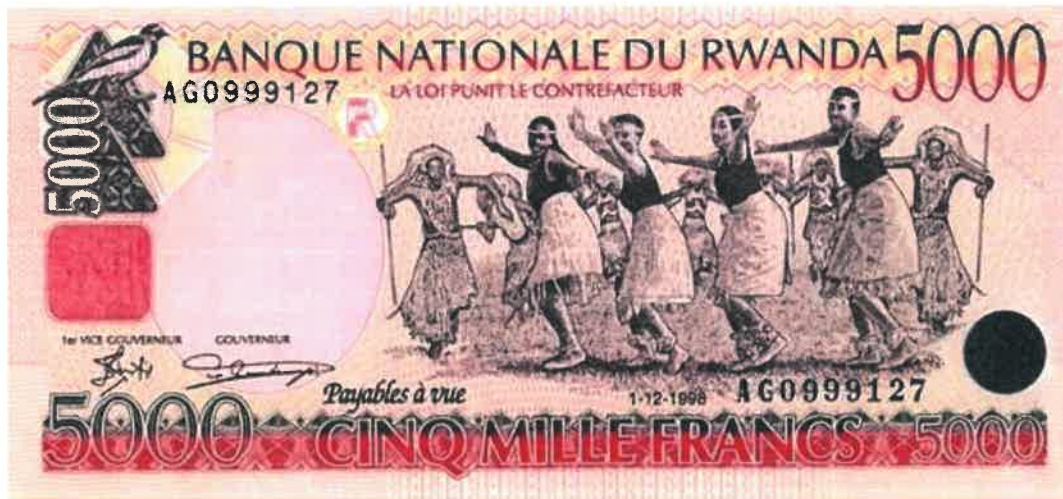
L'effigie d'Intore sur le billet bancaire de 5000 francs émis le 01/12/1998