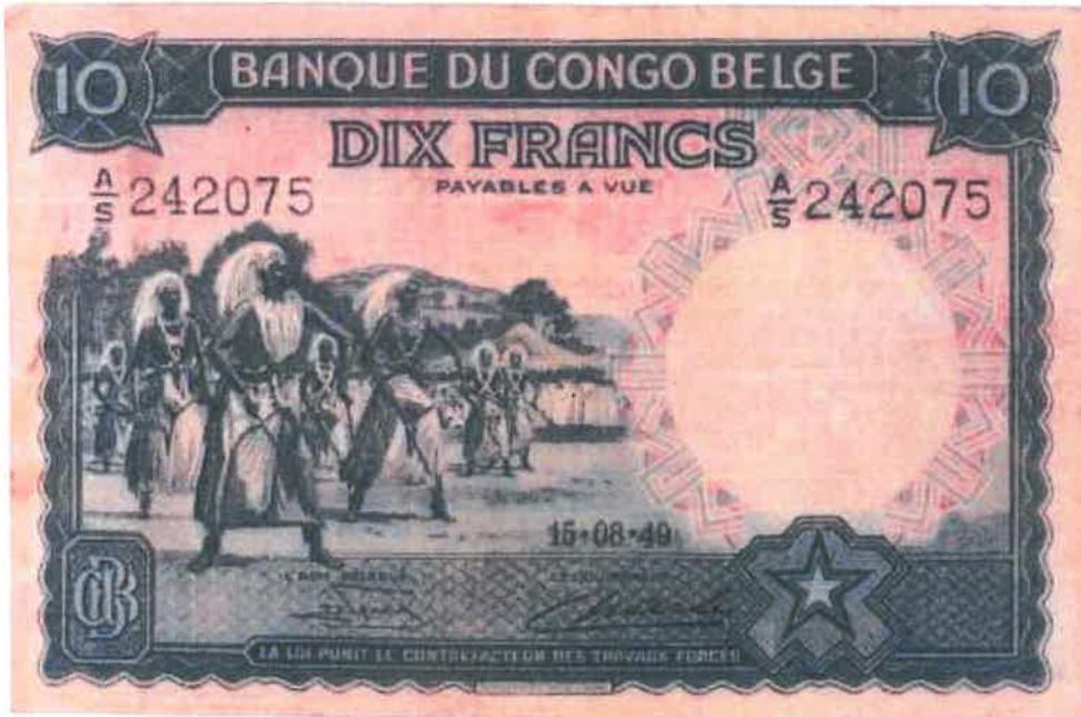
Ishusho y'Intore ku noti y'amafaranga 10 yashyizweho ku itariki 15/08/1949