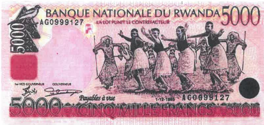
Ishusho y'Intore ku noti y'amafaranga y'u Rwanda 5000 yashyizweho ku itariki 01/12/1998