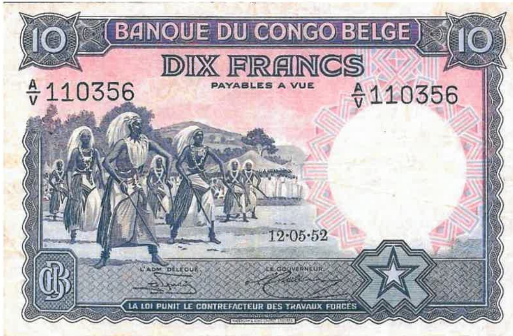
L'effigie d'Intore sur le billet bancaire de 10 francs émis le 12/05/1952