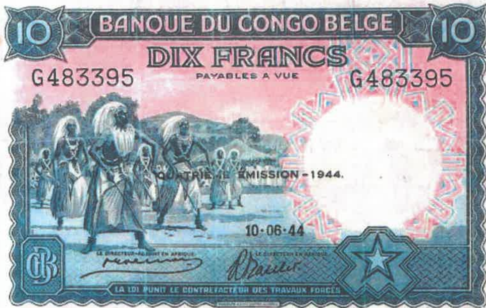
Ishusho y'Intore ku noti y'amafaranga 10 yashyizweho ku itariki 10/06/1944