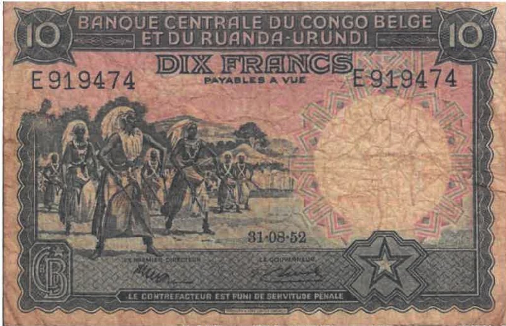
L'effigie d'Intore sur le billet bancaire de 10 francs émis le 31/08/1952