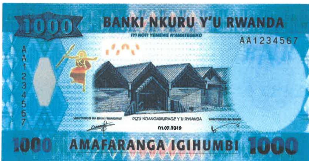
Ishusho y'Intore ku noti y'amafaranga y'u Rwanda 1000 yashyizweho ku itariki 01/02/2019