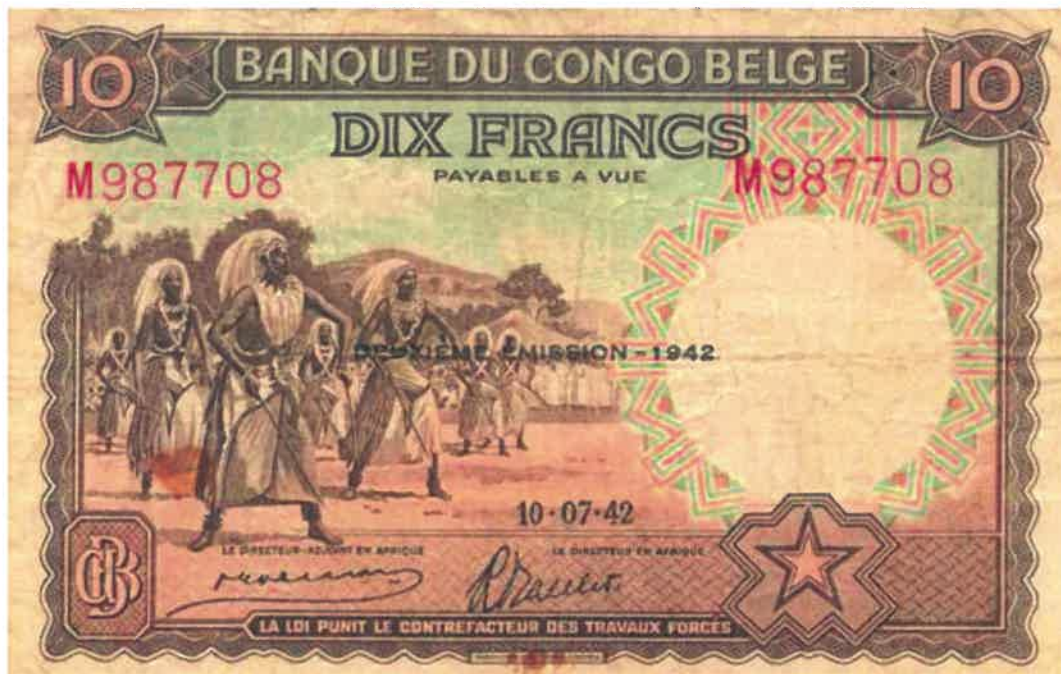
L'effigie d'Intore sur le billet bancaire de 10 francs émis le 10/07/1942