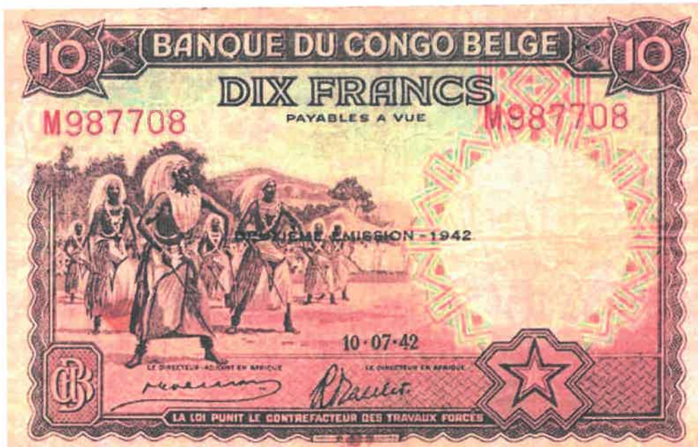
Ishusho y'Intore ku noti y'amafaranga 10 yashyizweho ku itariki 10/07/1942