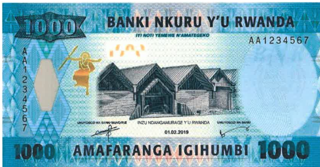
L'effigie d'Intore sur le billet bancaire de 1000 francs émis le 01/02/2019