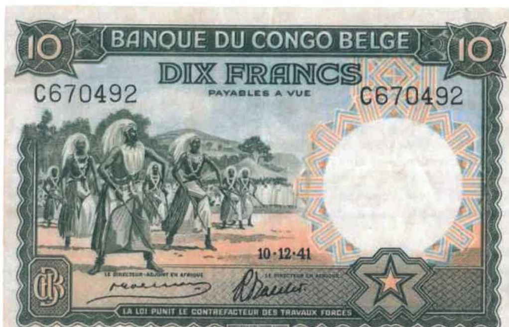
L'effigie d'Intore sur le billet bancaire de 10 francs émis le 10/12/1941

Lorsqu'il danse, tout Intore regarde vers l'avenir ; cela signifie que tout Rwandais devrait toujours avoir une vision, s'occuper de ce qui est important pour lui, pour la famille et pour le pays dans son ensemble, au lieu de regarder vers le bas ou de se soucier des futilités.