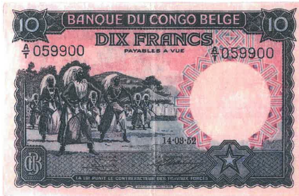
Ishusho y'Intore ku noti y'amafaranga 10 yashyizweho ku itariki 14/03/1952