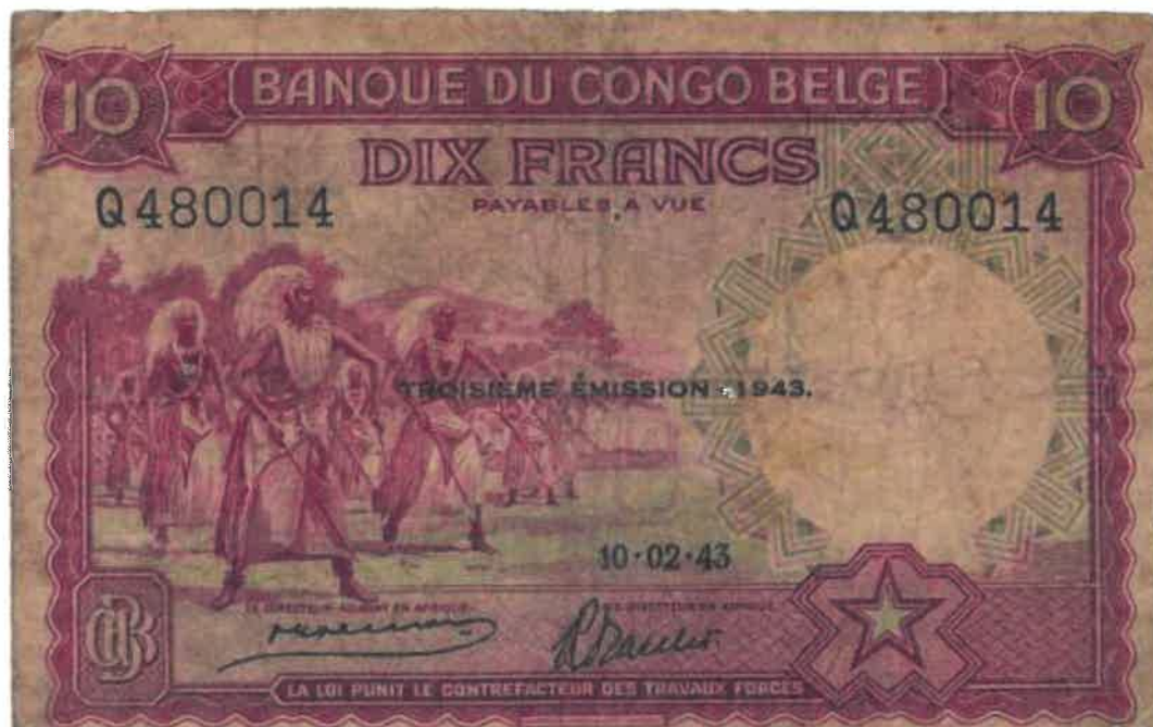
L'effigie d'Intore sur le billet bancaire de 10 francs émis le 10/02/1943