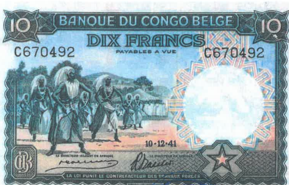
Ishusho y'Intore zihamiriza yashyizwe ku nsi y'amafaranga 10 ku itariki 10/12/1941

Iyo intore zihamiriza, zigera aho zigakora ibyitwa "kugwa mu nka" . Cyera imvugo y'ubuvanganzo bwa kinyarwanda yabagamo amagambo agenda agaruka kenshi yerekeye inka, urugamba n'ibindi. "Kugwa mu nka" bisobanura gusoza umuhamirizo. Ku byerekeye urugamba rw'ingabo bishushanya igihe ingabo zisoje urugamba, zitsinze umubisha, zikagabanya umurindi zari zifite, zigafata akaruhuko.