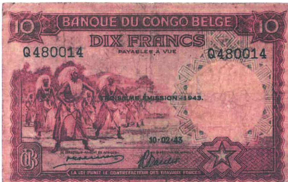
Ishusho y'Intore ku noti y'amafaranga 10 yashyizweho ku itariki 10/02/1943