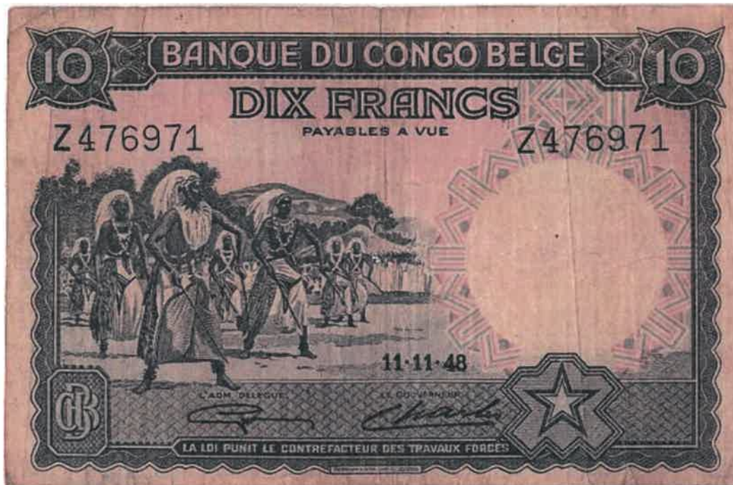
L'effigie d'Intore sur le billet bancaire de 10 francs émis le 11/11/1948