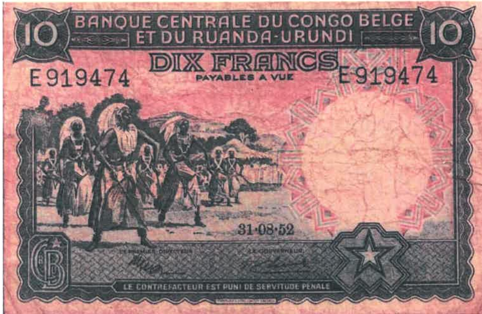
Ishusho y'Intore ku noti y'amafaranga 10 yashyizweho ku itariki 31/08/1952