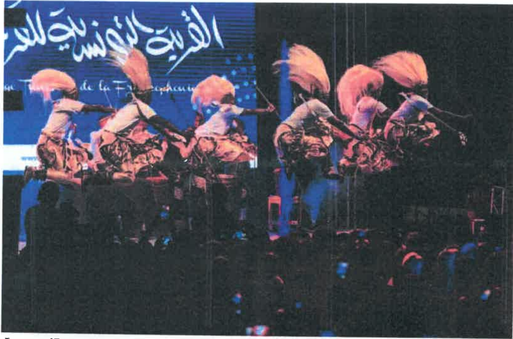
Intore z'itorero Ndangamuco ry'u Rwanda Urukerereza zihamiriza mu iserukiramuco rya Francophonie, Tunisia, 2022