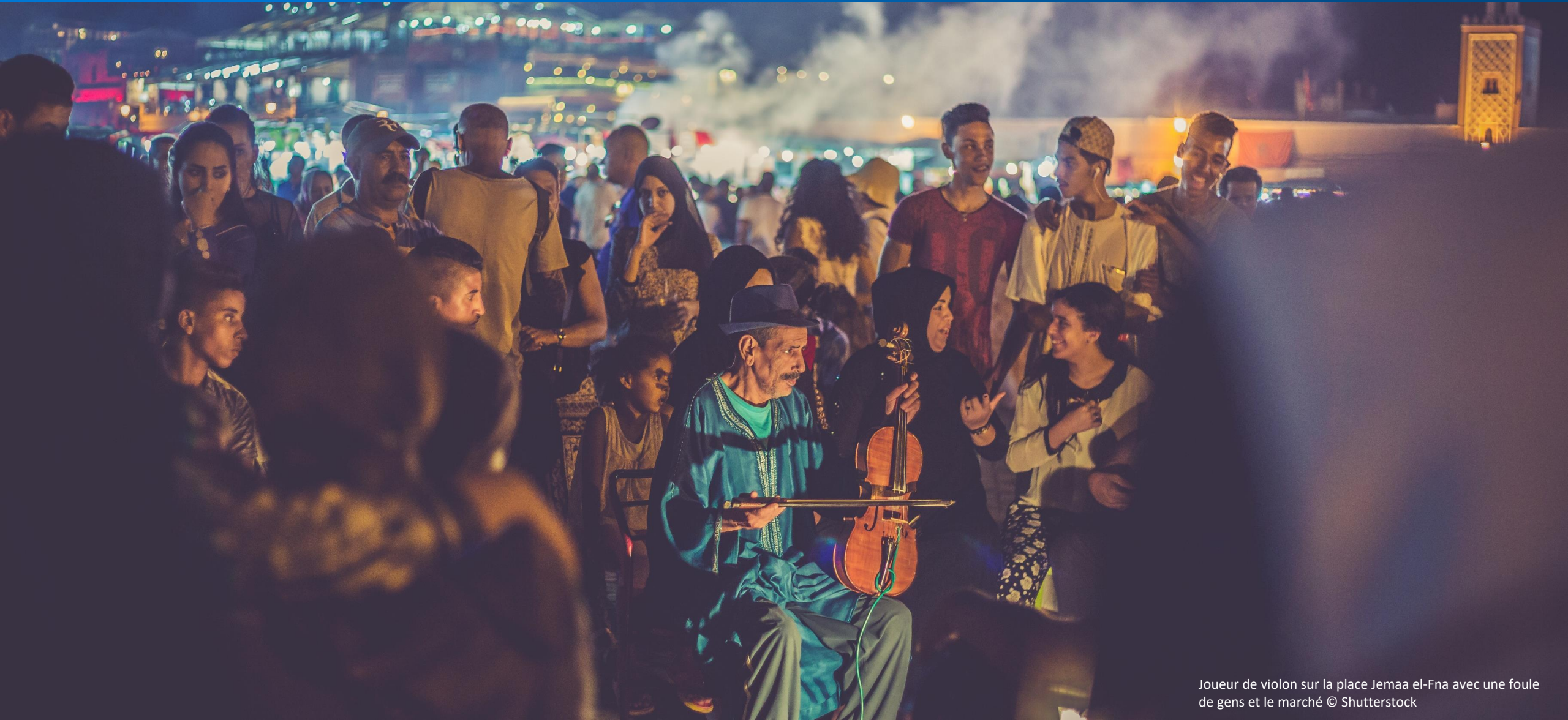
Joueur de violon sur la place Jemaa el-Fna avec une foule de gens et le marché