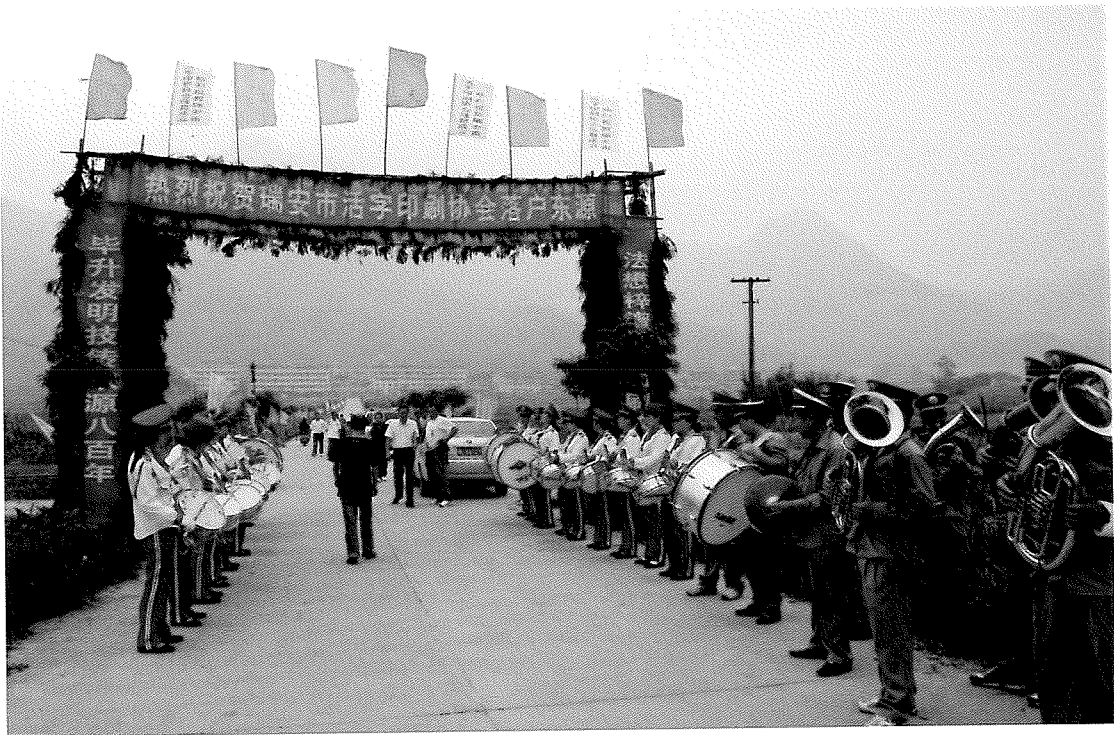
5、东源村举行盛大的仪式，祝贺活字印刷协会成立及东源村代表中国活字印刷术申报联合国教科文组织“急需保护的非物质文化遗产”名录