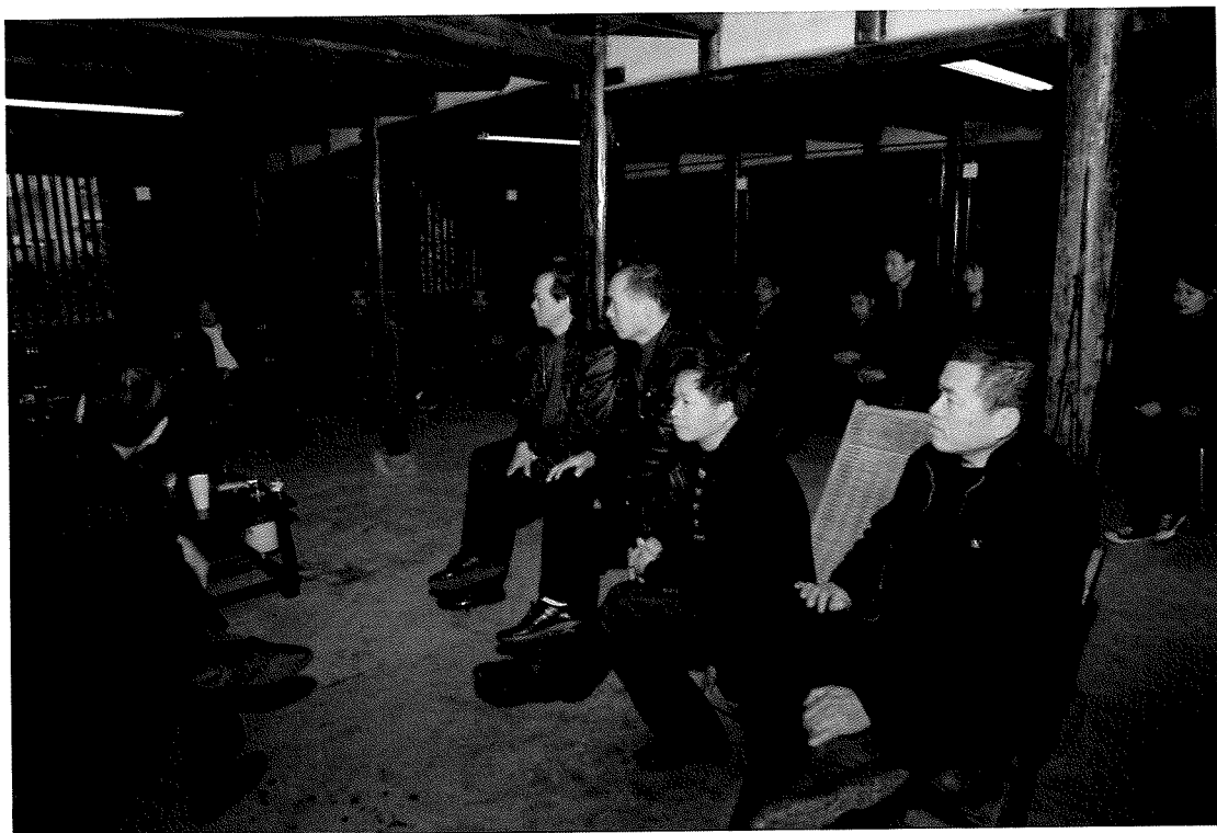
3、活字印刷传承人开会筹备成立活字印刷协会