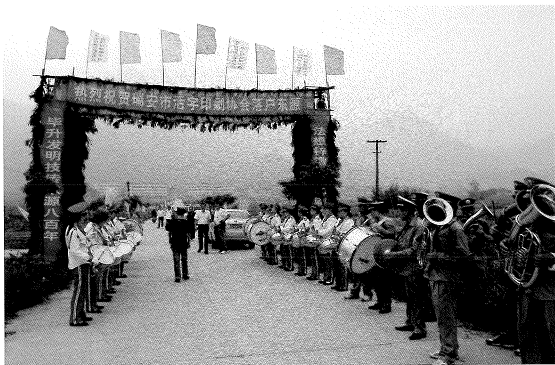
5、东源村举行盛大的仪式，祝贺活字印刷协会成立及东源村代表中国活字印刷术申报联合国教科文组织“急需保护的非物质文化遗产”名录