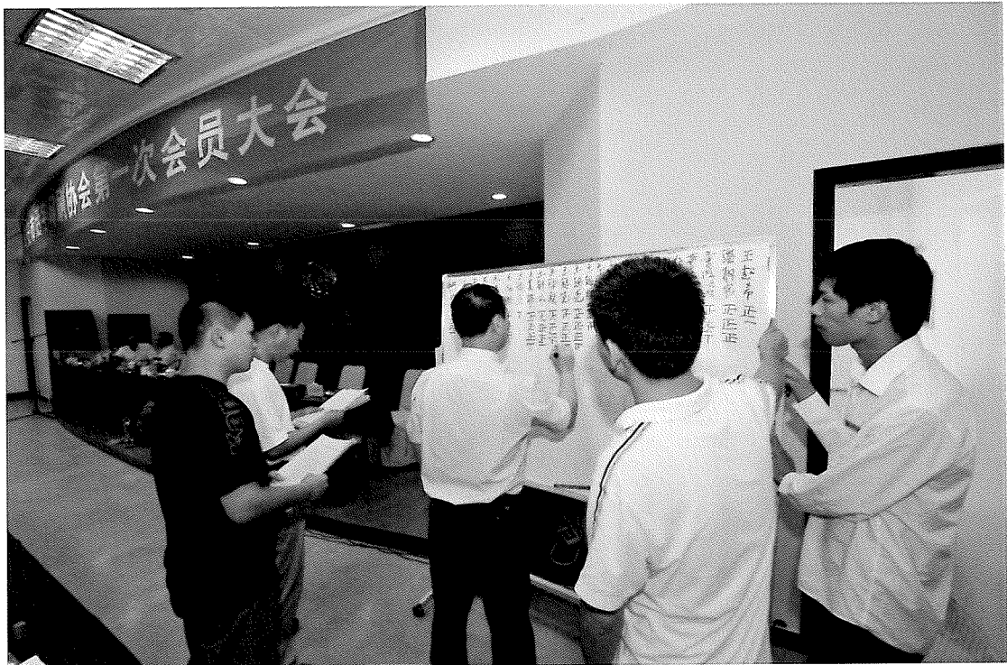
2、会员民主投票选举产生协会领导机构