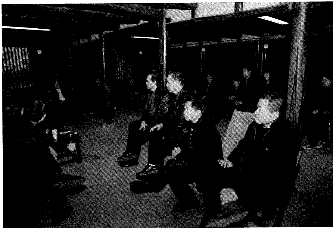
3、活字印刷传承人开会筹备成立活字印刷协会