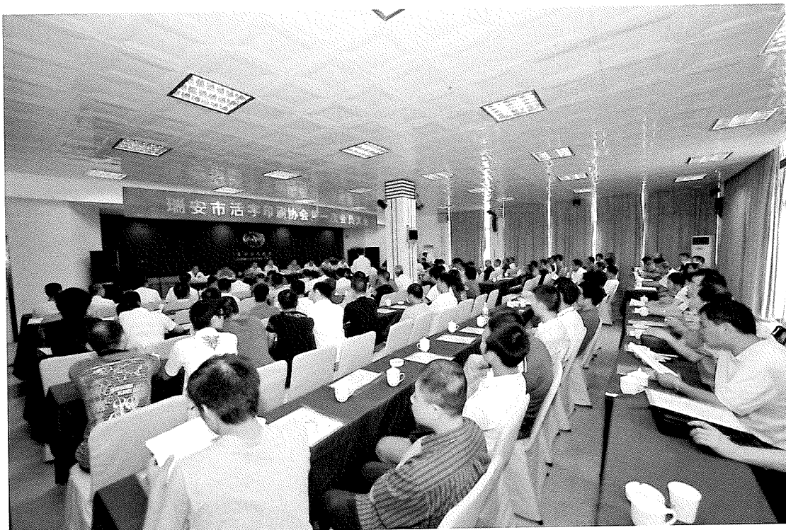
1、2009年6月10日，瑞安市活字印刷协会隆重成立