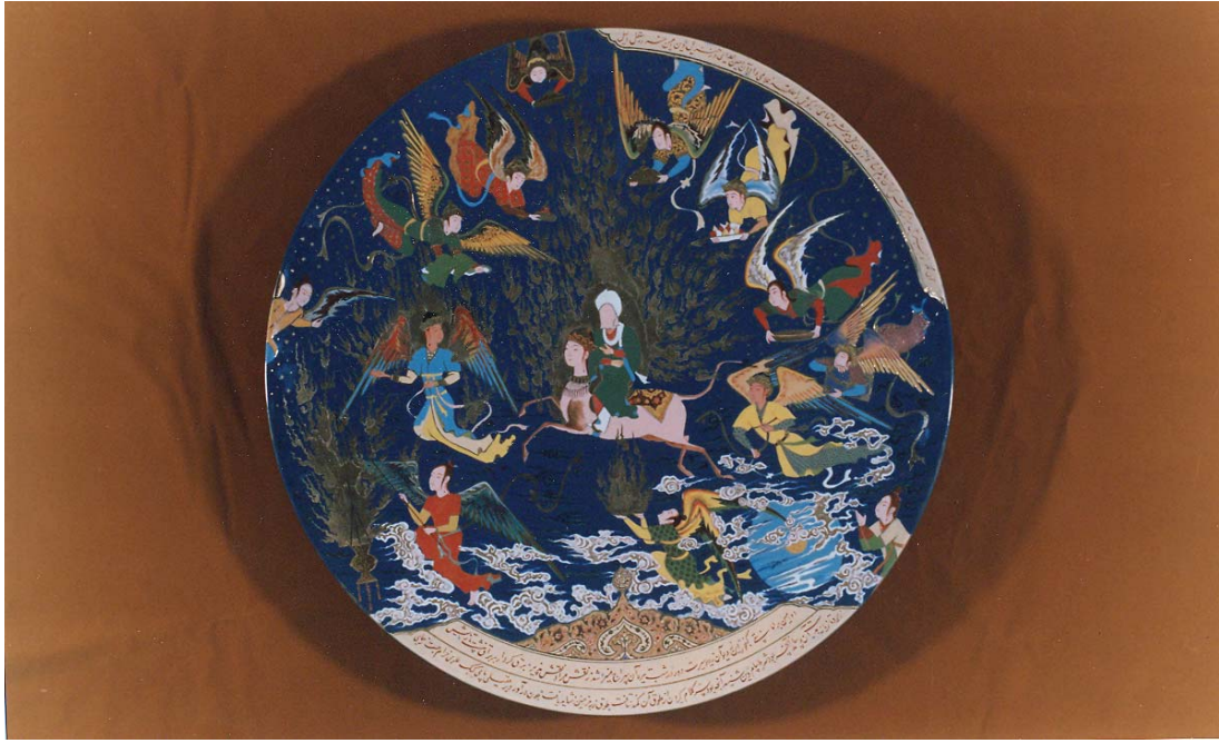
بر روی ظرف سفالی: معراج حضرت محمد به بهشت