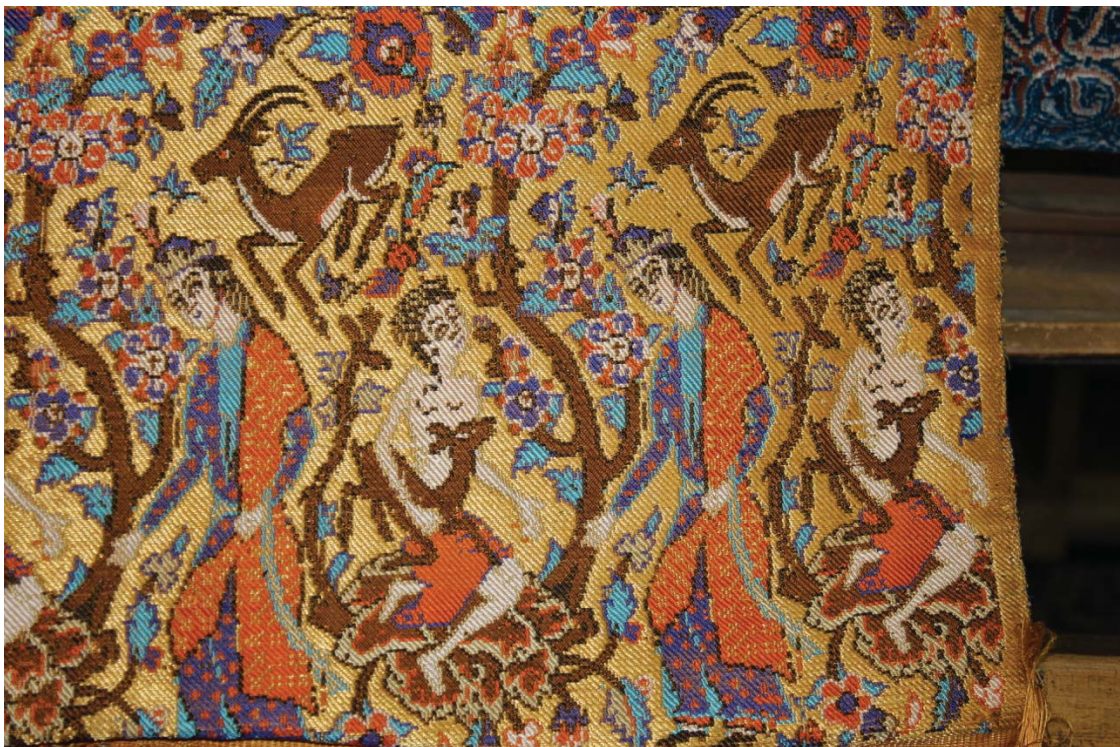
A Piece of Brocading Textile: Prince & the Boy