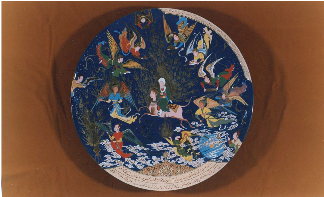
On a Ceramic Dish: Prophet Muhamad's Ascent to the Heaven