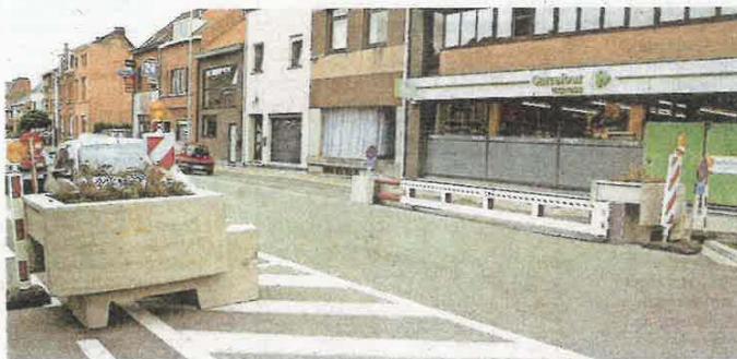
Een van de poorten staat aan de Gentssesteenweg, waar de stoet vertrekt.

De politie en de stad Dendermonde hebben vier veiligheidspoorten laten installeren voor de reuzenomgengang die donderdag door de straten van Dendermonde trekt. De poorten staan op de Gentssesteenweg aan de Carrefour, de Kasteelstraat, Oude Vest en de Zwarte Zustersstraat. «Vorig jaar hadden we ook al de turtles geïnstalleerd op de invalswegen tijdens Katuit, en op de Noordlaan een asverschuiving voorzien voor het verkeer. Deze maatregelen blijven ook, maar we hebben er een extra beveiliging aan toegevoegd», zegt korpschef Patrick Feys. «De poorten sluiten de feestzone volledig af, maar zijn ook snel