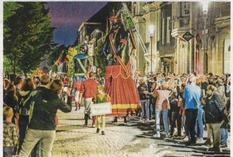
Een massa volk kijkt toe hoe de opgeknapte Indiaan, Goliath en Mars dansen.

De reuzen dansen! Dendermonde viert! Katuit trekt door de Dendermondse straten en dat is opnieuw een hoogdag voor de stad. De jaarlijkse ommegang brengt deze keer een ode aan kunstschilder Franz Courtens.