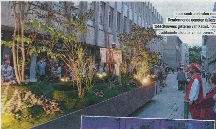
In de centrumstraten van Dendermonde genoten talloze toeschouwers gisteren van Katuit. "De traditionele afsluiter van de zomer."

Dat Dendermonde vroeger een haven had, konden de toeschouwers zien in een ander taferel. Het waren de pijnders, die in 2020 het Ros Beiaard dragen, die de zware havenarbeid uitbeeldden. "Nadien volgde opnieuw veel kleur, want Courtens was een landschapsschilder. Dat toonden we met een wagen vol bloemen en planten", gaat regisseur Segers verder.