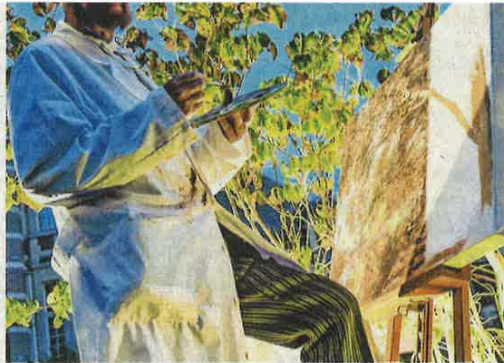
Op één van de praalwagens komt Franz Courtens tot leven.

hun Katuit niet van deze dingen zouden kunnen genieten.» Toch zijn er ook nieuwigheden. De Dendermondse kunstschilder Franz Courtens, die exact 75 jaar geleden overleed, is de rode draad doorheen de ommegang. De Dendermondse Pijnders dragen grote replica's van zijn kunstwerken rond en op verschillende praalwagens worden het leven van Courtens en zijn inspiratiebronnen uit het Dendermondse land-