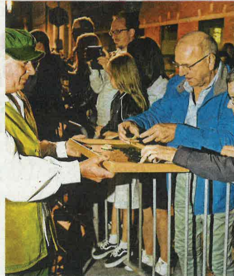
Kopvlees voor iedereen.