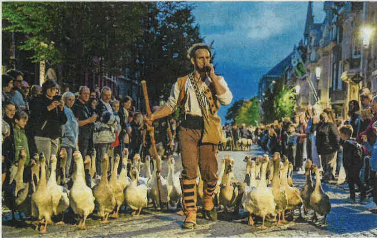
Een tafereel over het boerenleven krjgt levende ganzen mee.