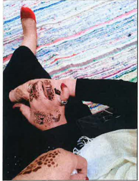
صورتان توضحان تقنيات نقش الحناء صورتان توضحان تقنيات نقش الحناء