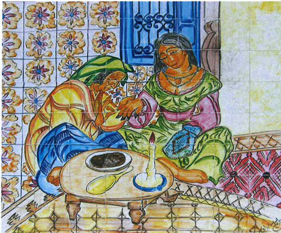
Un tableau mural