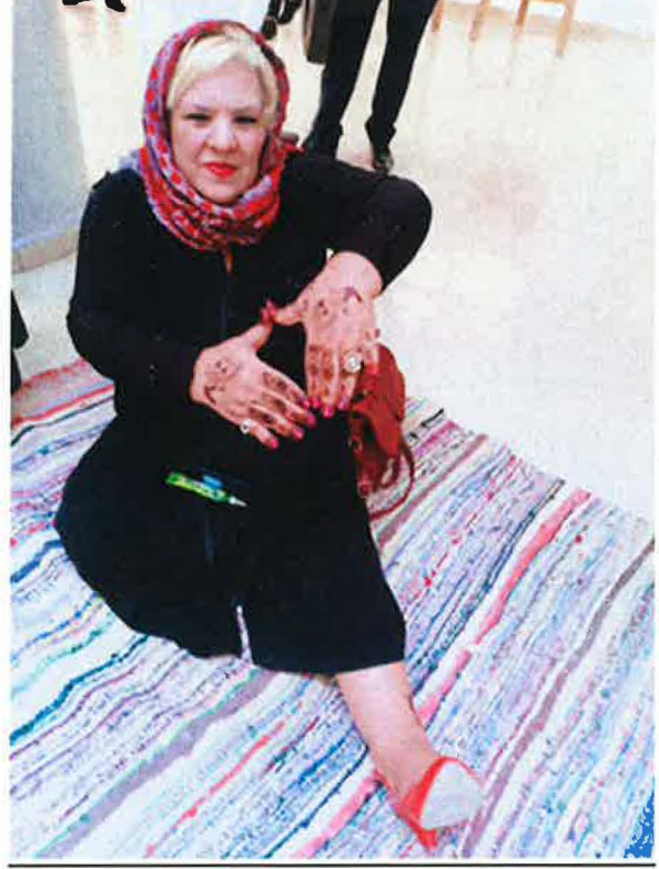
صورة توضح امرأة من "تيميمون" محنية اليدين على الطريقة العصرية ( تقنية التحنية على شريط لاصق مزخرف ).