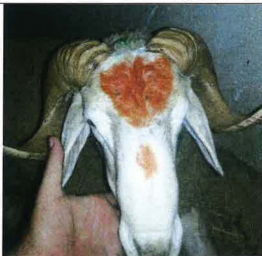
Mouton de l'Aid Adha