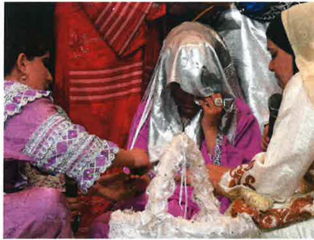
صورة توضح تمثيل حنة عروس وهي تذرِف الدموع

يعتري طقوس حنة العرس مخاوف كبيرة متعلقة بالسحر والشعوذة. فالمتزوجان اللذان لا يولد لهما مولود في السنوات الأولى من الزواج بالرغم من عدم وجود عائق، يعتقد أنه قد وضع لهما شيء من السحر في حنة الزواج. فالمعتقد الشعبي يربط مباشرة ما بين الحنة وتعطيل الانجاب وحتى تعطل المعاشرة الزوجية. وهذا ما يسمى رباط الحنة. أي ربط وإعاقة الجسد عن تأدية ممارساته الجنسية المتعلقة بالخصوبة. ولذلك، يحرص المقربون للعروسين مثل الجدة، الأم، الأخوات، الخالات أو العمات، على استنفاذ كامل كمية الحناء الممزوجة في يد العروس أو العريس، واسترجاعها من أيديهم متى جفت. وما يتبقى في قاع الصحن يسترجع تحت مراقبة صارمة ويحلل في ماء طاهر وبعد ذلك يرمى في تربة صالحة بعيدا عن الأعين. وفي عديد من المرات عندما كانت تحني العروس فإنها كانت تذرِف الدموع، لأن بهذا الطقس هي تعلم بأنها على مقربة من مفارقة بيت والديها ومفارقة البيت التي ترعرعت فيه، وخصوصا أن البنات كن يزوجن في سن مبكرة.