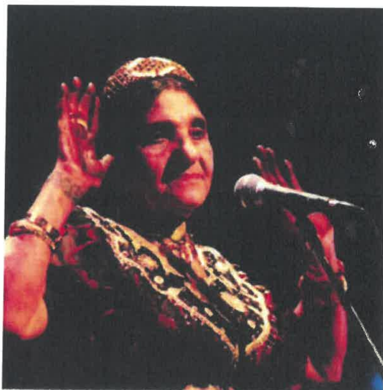
Le henné mythique de Chikha Remitti

Médéa, Alger, Bordj Bouarreridj -Algérie