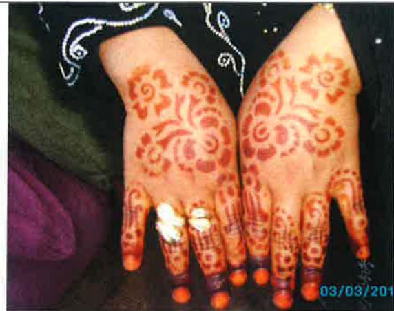
Henné aux mains