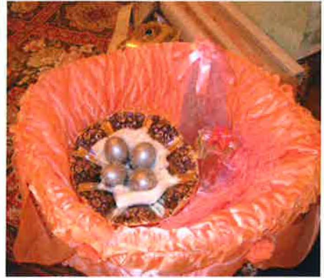
صورتان توضحان طبق الحنة المحضر سلفا في بيت العريس

من طقوس "يوم الحنة" في منطقة وهران، أن يقدم أهل العريس حاملين أطباق الهدايا وأنواع الأطعمة المختلفة من أجل إقامة الوليمة في بيت أهل العروسة، وكذلك طبق " الحنة " المتكون من مسحوق الحنة والبيض وماء الزهر والعطر وإناء فخم لمزج هذه العناصر أمام الملاء. وغالبا ما تختار الجدة أو إحدى العجائز أو إحدى النساء الموقرات من العائلة تيمنا بها من أجل وضع خليط الحنة في كف العروسين، وتسمى هذه الممارسة " ربط الحنة ". يقال تربط الحناء، لأنه بعد