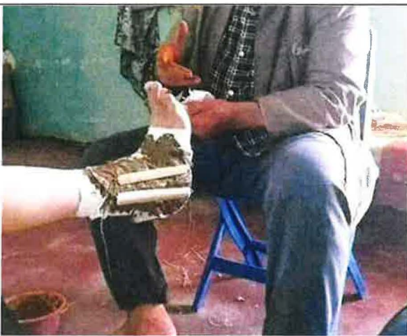
Soin des rhumatismes