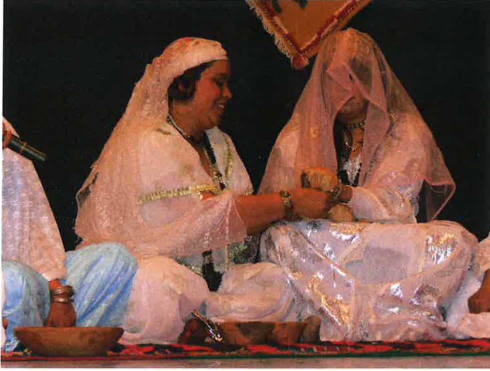
صورة توضح ربط الحناء بخرقة قماش في يد العروس (قصر البخاري/ ولاية المدية)

في التقاليد، عندما تحنى العروس يكون رأسها مغطى إحتشاما ووقارا، ولكي لا تؤذيها قوى الشر من عين أو حسد، وتحنى يدها ثم توضع في راحتها قطعة من ذهب (لويزة). وفي غياب هذه القطعة الثمينة، يوضع خاتم من ذهب. وعند القبائل، توضع قطعة من فضة وفي الصحراء توضع نواة من تمر للبركة.