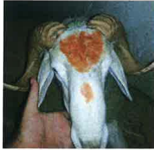
صورة توضح وضع الحناء على وجه الأضحية قبل نحرها يوم العيد