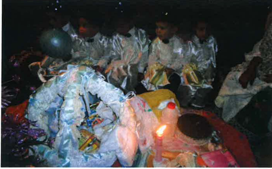
صورة لمجموعة من الأطفال قبل تختينهم وهم يضعون الحناء (جمعية الأصالة وجمعية البشائر/ المدينة)