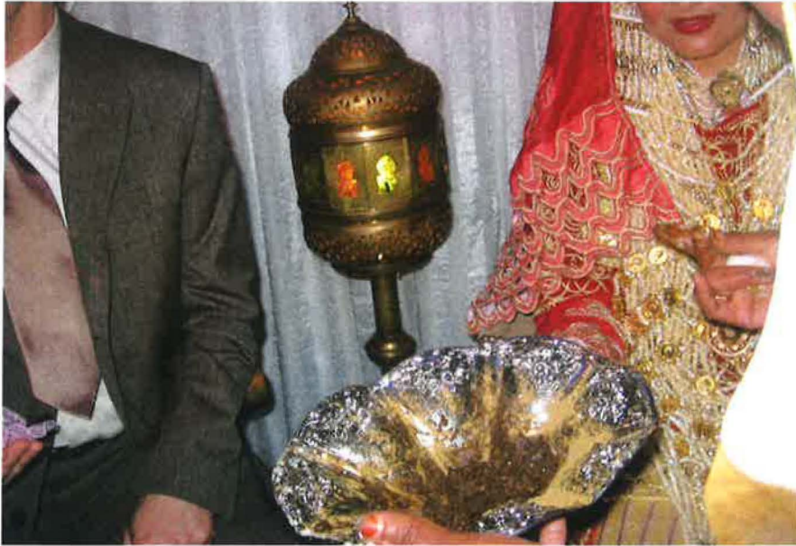
صورة توضح تقنية العرسان

كما أنه خلال هذا اليوم، وحسب العادة، إما أن يحني العروس وحده والعروسة في بيت أهلها أو أن يدخل الزوج إلى بيت زوجته فيحنيان مع بعض. وبذلك تصبح كلمة "حنة" تعني الزمن والطقس والنبات والتقنية والممارسة والنذر والحب والمودة.