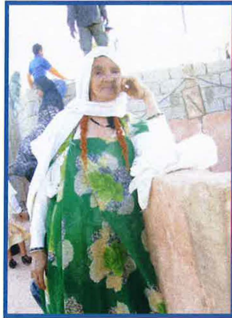
صورة توضح امرأة زناتية من تيميمون وقد زينت جدائل شعرها

في طريقة وضع الحناء، هنالك العديد من التقنيات التقليدية. فبمجرد خلط مسحوق الحناء مع الماء، تصبح على شكل مرهم قابل للاستعمال حسب الشكل المرغوب. قد يوضع على كامل راحة اليد، حتى أطراف الأناامل والأظافر، أو يقتصر على نصف الراحة أو على تشكيل بعض الأشكال الهندسية، كالقرص مثلاً. وكما توضع في اليدين، توضع كذلك في القدمين أو على الرأس لأجل صباغة الشعر وتلوينه زينة.