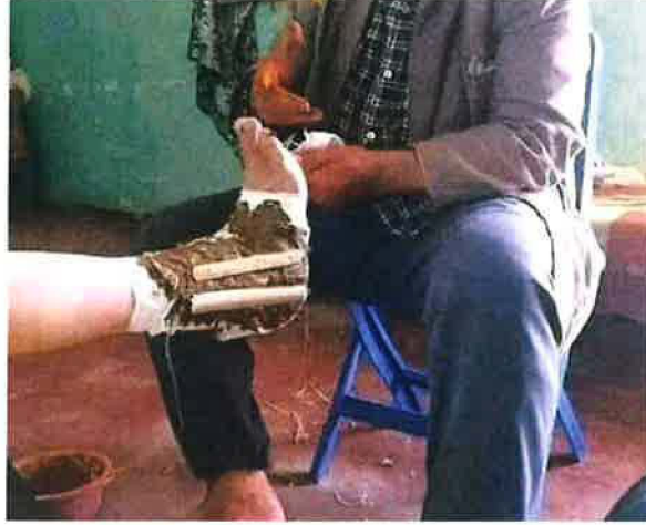
صورة توضح استعمال الحناء في الطب الشعبي لمعالجة الكسور

منذ القدم، عرفت مزايا الحناء العلاجية، فاستعملها الأسلاف لمعالجة الرضوض والكسور وتقرحات المعدة والجروح وجفاف البشرة وارتفاع حرارة الجسم، فكانت تحنى نهايات الأطراف للرجال والنساء. وقد شاع استعمالها لمشاكل فروة الرأس والصداع.