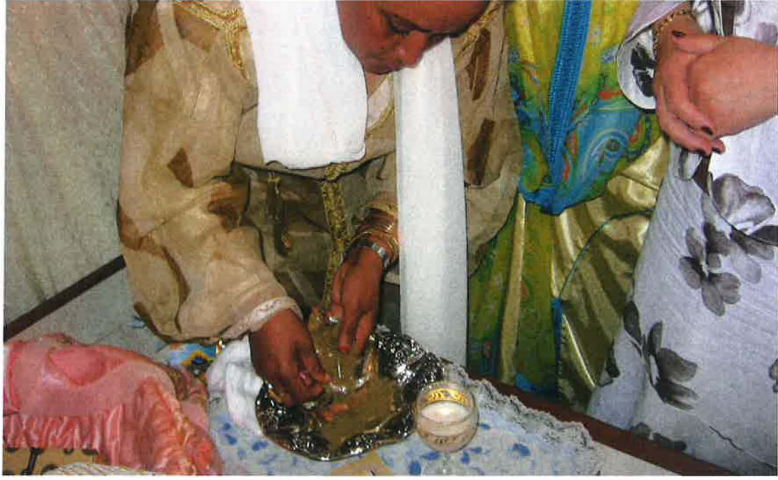
صورة توضح أحد النساء وهي تحضر معجون الحناء لربطها للعروسين

كما أنه خلال هذا اليوم، وحسب العادة، إما أن يحني العروس وحده والعروسة في بيت أهلها أو أن يدخل الزوج إلى بيت زوجته فيحنيان مع بعض. وبذلك تصبح كلمة "حنة" تعني الزمن والطقس والنبات والتقنية والممارسة والنذر والحب والمودة.