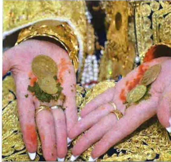
صورة توضح التحنية العروسة ووضع قطعتين من اللويز فوق الحنة (من عادات منطقة برج بوعريريج)

في التقاليد، عندما تحنى العروس يكون رأسها مغطى إحتشاما ووقارا، ولكي لا تؤذيها قوى الشر من عين أو حسد، وتحنى يدها ثم توضع في راحتها قطعة من ذهب (لويزة). وفي غياب هذه القطعة الثمينة، يوضع خاتم من ذهب. وعند القبائل، توضع قطعة من فضة وفي الصحراء توضع نواة من تمر للبركة.