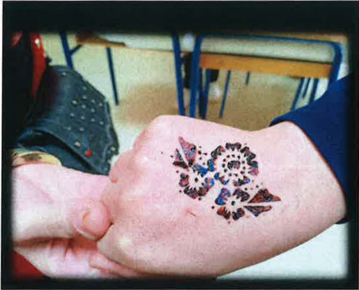
صورة توضح طريقة معاصرة لنقش الحناء على اليدين/ برج بوعربريج