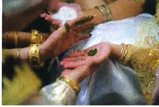
صورة توضح تقنية حديثة في تحنية العروسة

فالحنة" في مناسبات الزواج، هي فأل حسن يرمز للخصوبة والسعادة الزوجية والبركة، وإن اختلفت تقنياتها وأشكالها ما بين الماضي والحاضر. ففي حين كانت العروسة في السابق تحني كامل أطرافها (باطن الكفين والرجلين)، أصبح العروسان اليوم لا يرضيان إلا بتشكيل قرصين صغيرين في كفيهما.