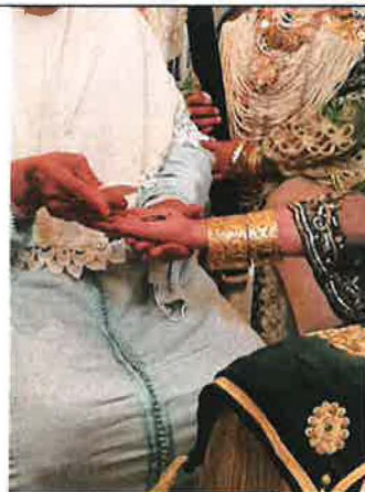
Pose du henné de la mariée