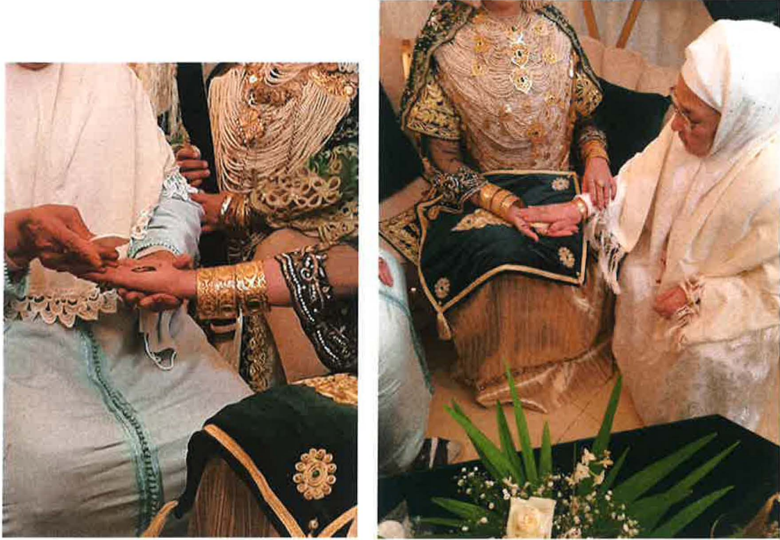
صورتان توضحان عجوز وهي تضع الحنة في يد العروسة وأخرى تبارك هذه الحناء

وضعها على العضو المراد، تغطى بقطعة من القماش، لكي تجف على الحال التي وضعت عليه، دون أن تتعدى الشكل المحدد لها. وربما تترك ليلة كاملة، فلا تفسدها مواضع الجسد حين النوم وما شابه ذلك. وأثناء هذه الممارسة تردد النسوة الحضور والعجوز ترانيم وأهازيج معينة مثل: " حني حني يا لحنينه والحنة جبتها أحنا..."