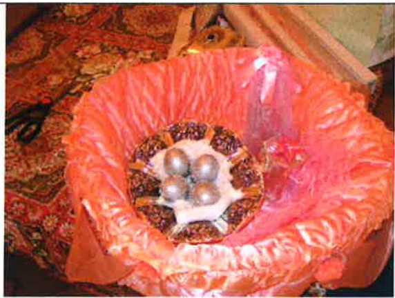
Œufs colorés argent