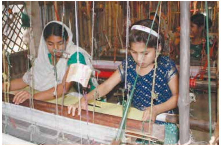
© 2012 by Firoz Mahmud - Photograph: Murshid Anwar

байж болно. Мөн түүнчлэн бодлогын үйл ажиллагаа нь олныг хамарсан, үр дүнтэй байхын тулд тухайн улсын нутаг дэвсгэр дэх хүйстэй хамааралтай олон төрөл ёс заншлуудыг авч үзэх шаардлагатай.