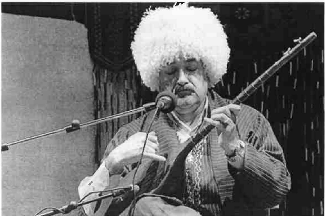
دوتار نواز ترکمن در استان گلستان، ترکمن صحرا