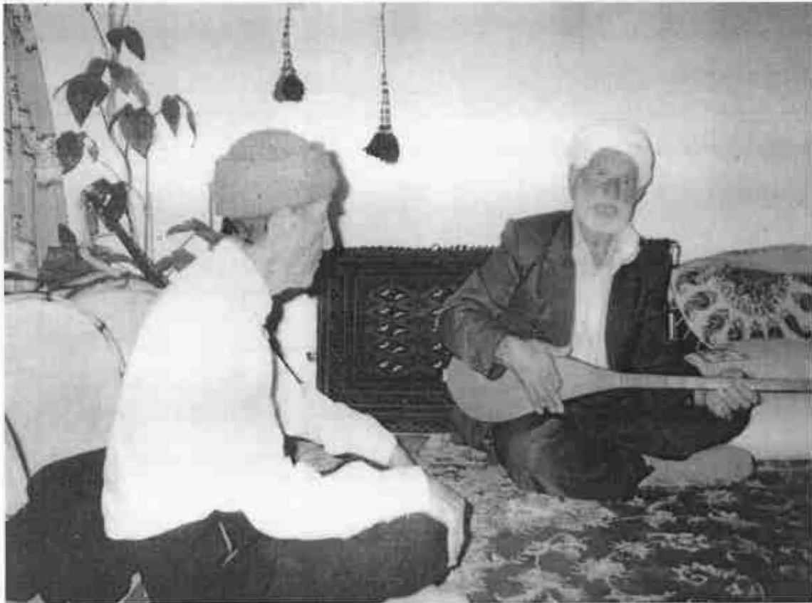
Meeting of Two Dotār Masters, One from the North Khorasan Province (Shiite) and the Other from the Razavi Khorasan (Sunni)