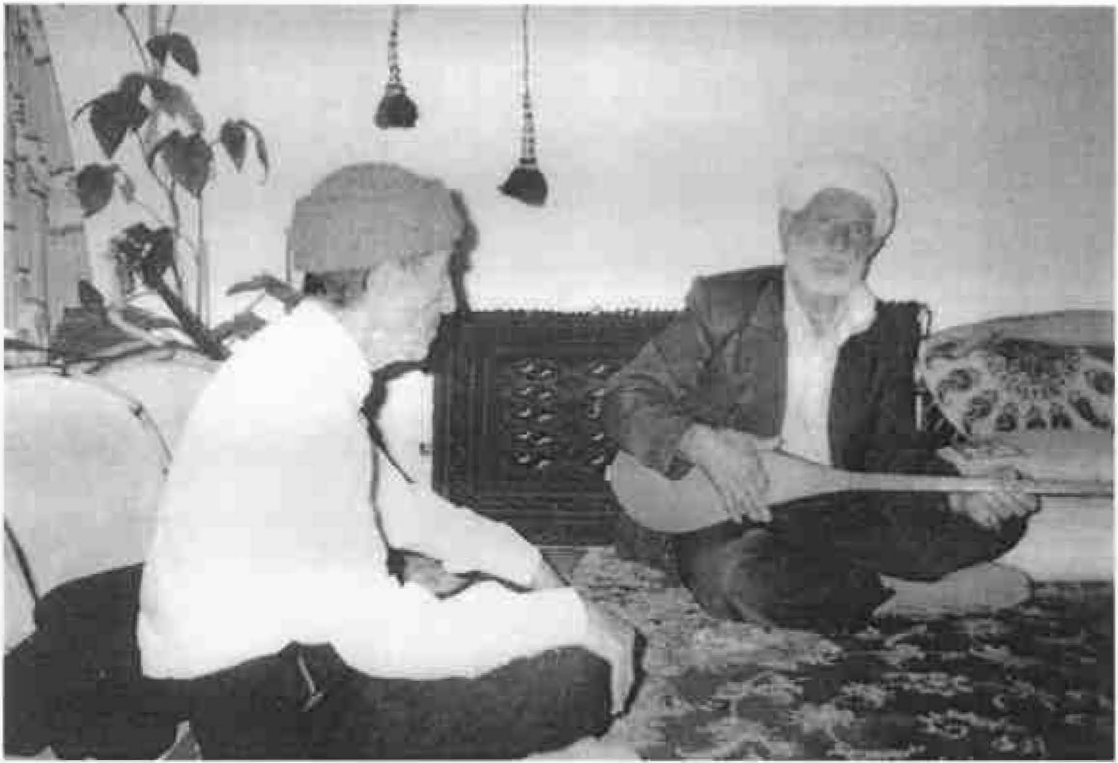
ملاقات دو استاد دوتارنواز از خراسان شمالی (شیعه) و خراسان رضوی (سنی)