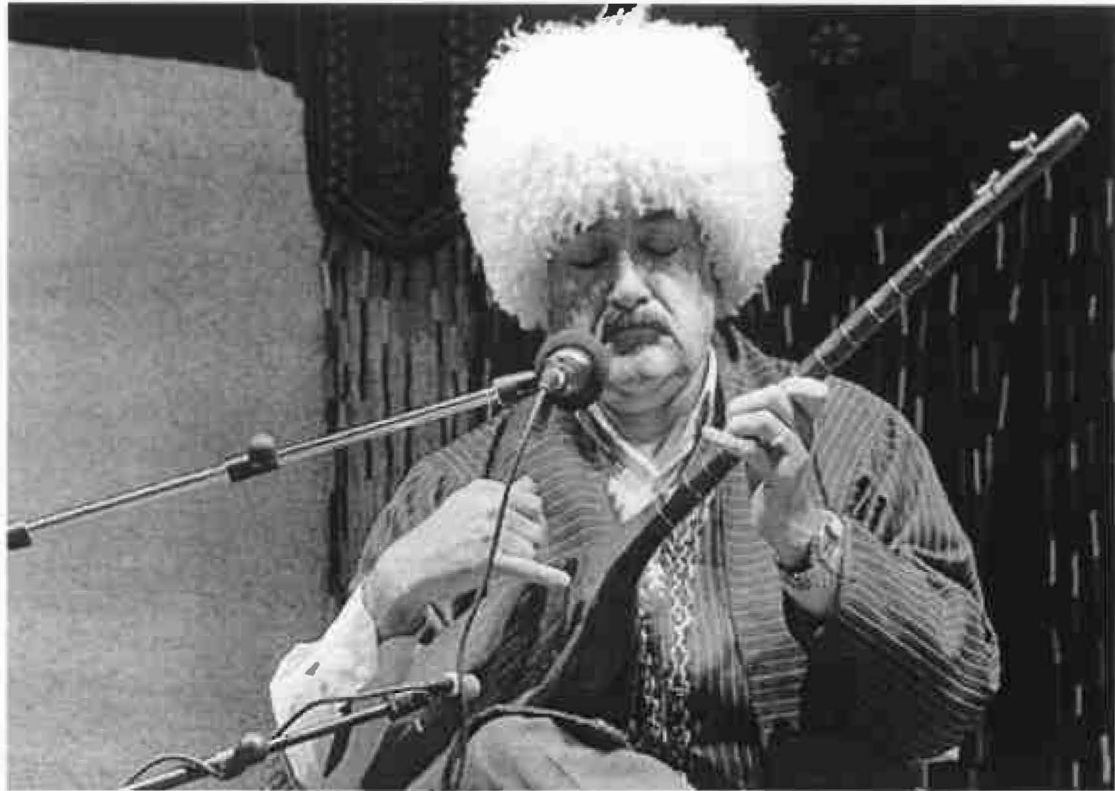
Turkmen Dotâr Player in Goestan Province, Turkman Sahra Region