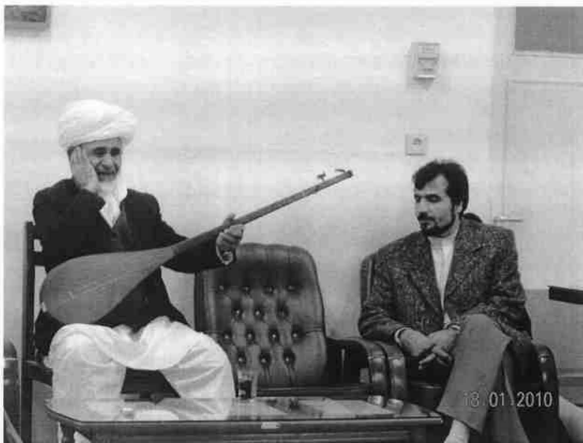
دوتار نواز خراسان رضوی، تربت جام