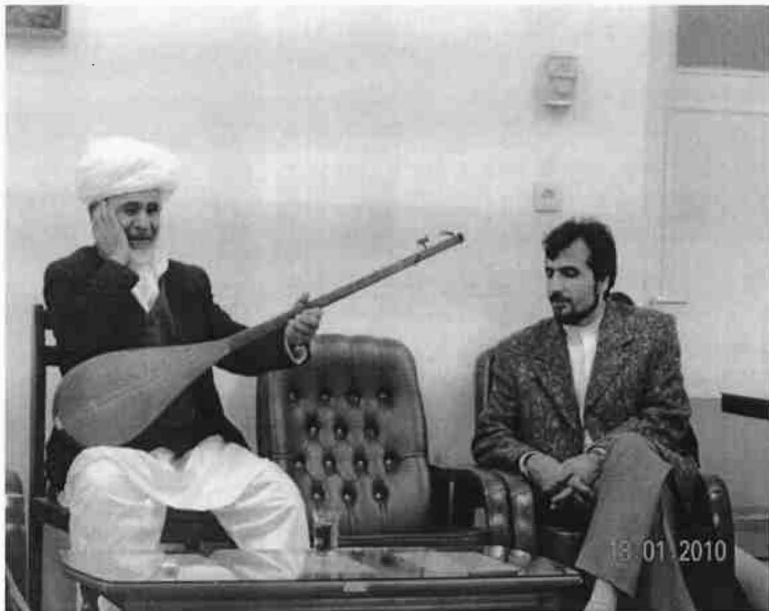
A Dotâr Player from the Razavi Khorasan Province, Torbat-e Jam