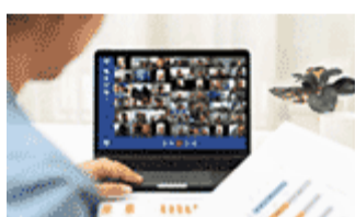
Online Meeting with National Focal Points for Periodic Reporting in Asia and the Pacific, 24 September 2020 (24/09/2020)