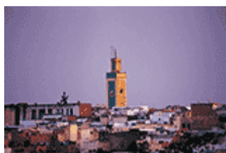
Ville historique de Meknès (Maroc);

Voir l'enregistrement du webinaire (en anglais).