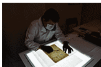
Documentary heritage conservation