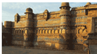
Gwalior Fort