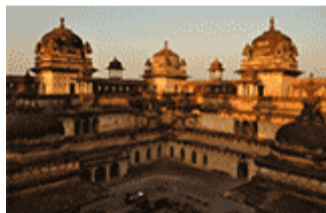
Jahangir Mahal, Orchha