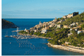
Portovenere, Cinque Terre et les îles (Palmaria, Tino et Tinetto) (Italie)