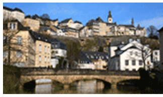
Ville de Luxembourg : vieux quartiers et fortifications (Luxembourg); Auteur: Amos Chapple; © OUR PLACE The World Heritage Collection