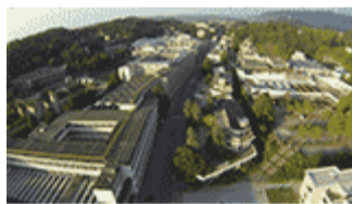
Corso Jervis, au premier plan, l'Officine ICO et le Centre de services sociaux; Auteur: Maurizio Gijvovich; © Guelpa Foundation