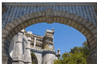
Paysage culturel de Sintra (Portugal);

En outre, les centres historiques de Gwâlior et d'Orchha ont tous deux vu le tourisme religieux et culturel prendre de l'ampleur, ce qui a grandement contribué au développement économique des villes. Cette croissance s'est accompagnée des effets négatifs liés à une urbanisation rapide et incontrôlée et à un tourisme non durable. Les deux villes incitent au déploiement d'un effort de politique publique nuancé et renouvelé et présentent des arguments convaincants en faveur de l'adoption de l'approche de la Recommandation HUL. Proposé sur 48 semaines, le projet vise à produire un ensemble de recommandations à prendre en compte dans la planification du développement urbain de Gwâlior et d'Orchha. Le bureau de l'UNESCO à New Delhi se chargera d'offrir la formation et l'expertise technique qui sont essentielles à la mise en œuvre de l'approche de la Recommandation HUL au niveau local. Ce projet reposera également sur un engagement à plusieurs niveaux entre des experts, des organismes urbains locaux, des autorités civiques et des parties prenantes de la communauté afin de développer des partenariats à long terme, une sensibilisation et des relations entre la conservation du patrimoine culturel et le développement durable.