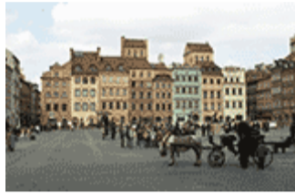
Centre historique de Varsovie; Auteur: Powel Kobek; © Narodowy Instytut Dziedzictwa

En savoir plus sur la réunion « Climat, villes et culture » Découvrir les autres activités du programme de Daring Cities 2020 (en anglais).