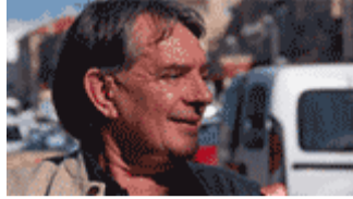
John Hurd © Xiaofan Huang

Le Centre du patrimoine mondial a salué les efforts déployés par le Maroc pour promouvoir un logement décent pour tous et a souligné l'intégration des politiques en matière de conservation du patrimoine culturel et de changement climatique dans l'urbanisme, conformément à la Recommandation de l'UNESCO concernant le paysage urbain historique, adoptée en 2011. L'évènement a également mis en lumière comment la crise mondiale du logement a été aggravée par la pandémie de Covid-19.