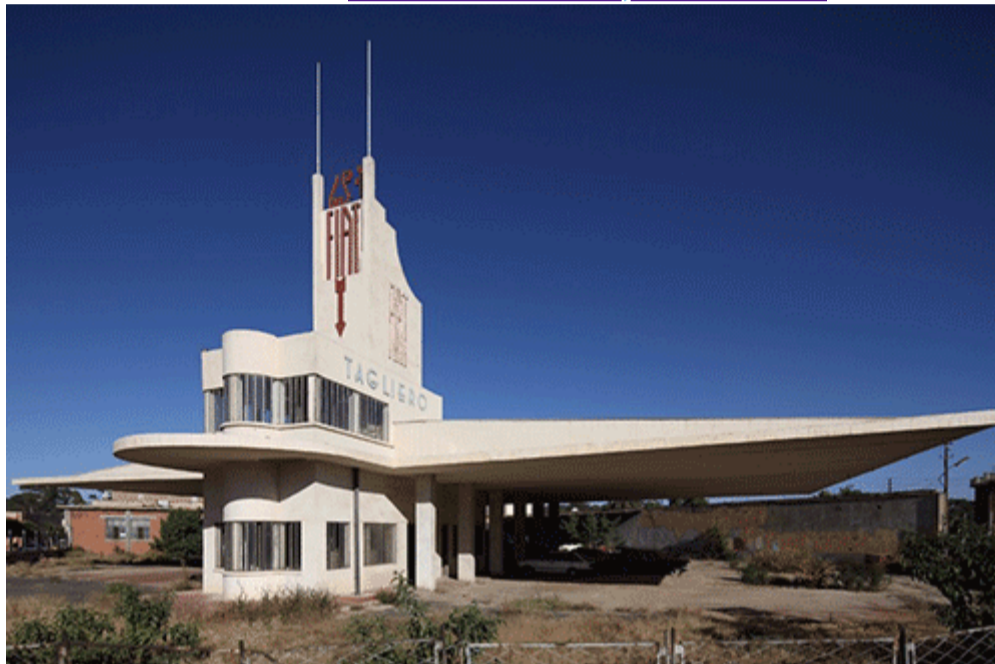
Asmara : une ville africaine moderniste (Érythrée). Auteur : Dr Edward Edison, © Asmara Heritage Project