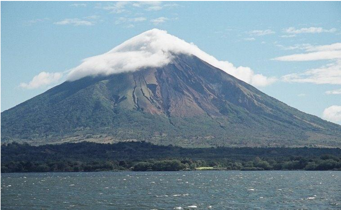
Volcán Mombacho.