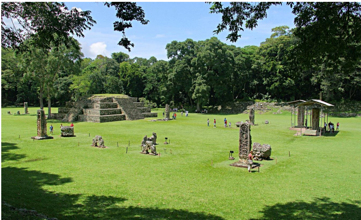
Gran Plaza de Copán.